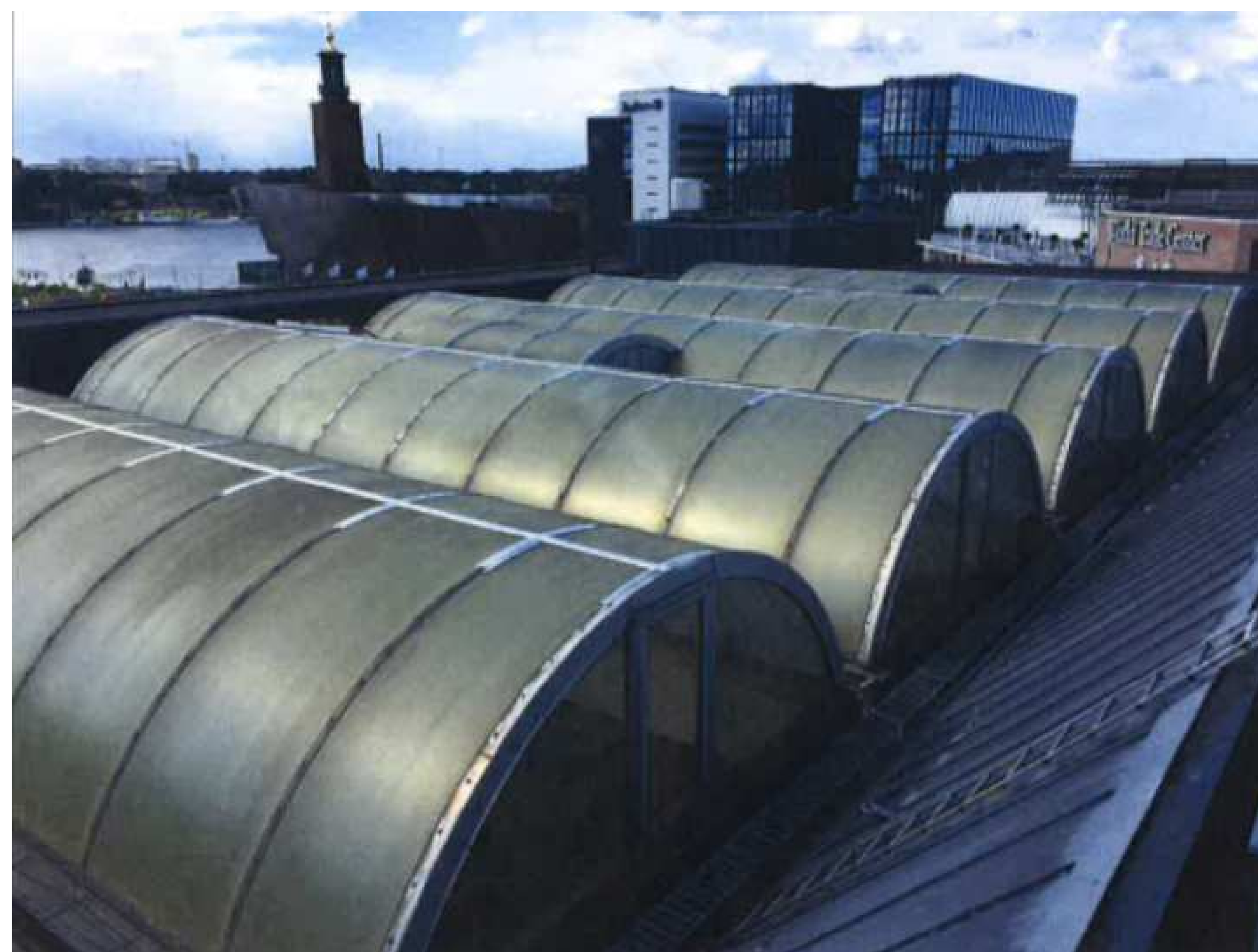
EXISTING DOMED POLYCARBONATE ROOFLIGHTS