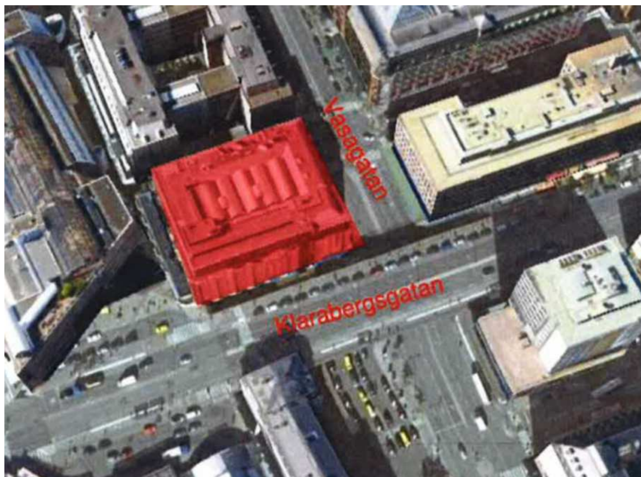
SITE LOCATION PLAN