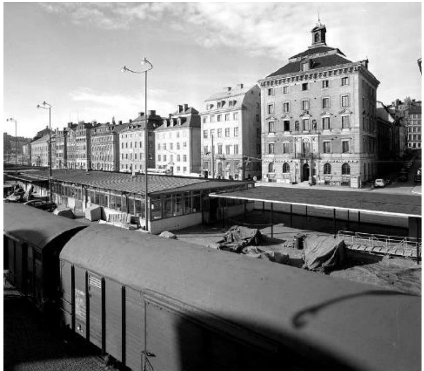
Tullhus 1. Ända in på 1960-talet var det full verksamhet utmed Skeppsbron. Idag är det svårt att förstå den viktiga betydelsen byggnaderna haft för hamnverksamheten.