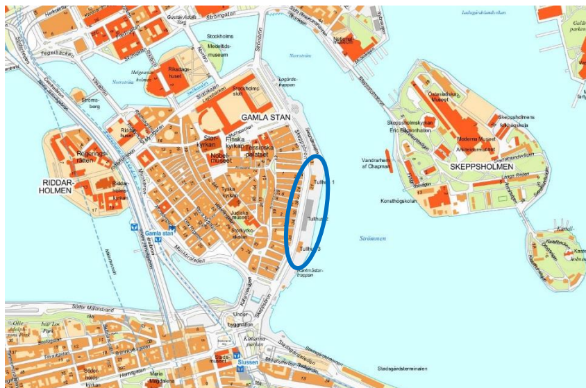
Figur 1, läget för de tre tullhusen markerat med blå ring.