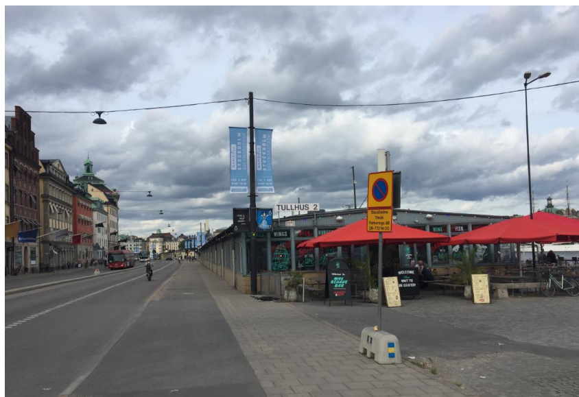
Tullhus 2 och Skeppsbrons väg för motorfordon mot norr. Längs bilvägen finns både trottoar och cykelkörfält.

Väster om planområdet går Skeppsbrons väg för motortrafik samt gång- och cykelbanor.