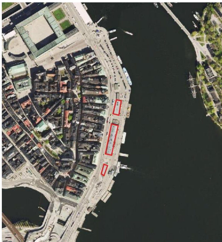
Figur 2. De tre tullhusen markerade med röda rutor.