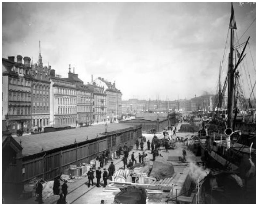
Det fanns tullhus utmed skeppsbron redan på slutet av 1800-talet. De var placerade i ungefär samma lägen som idag.