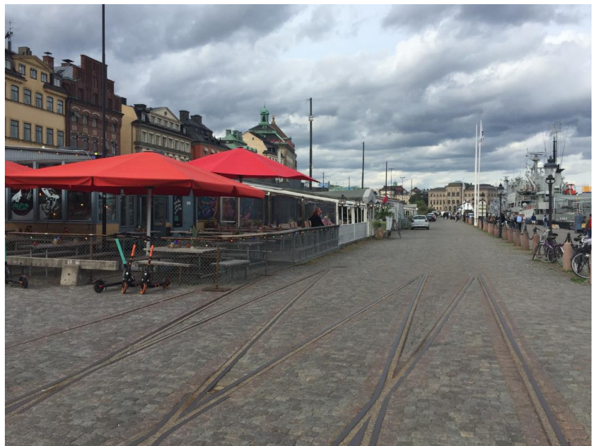
Spår från tidigare järnväg längs kajen.