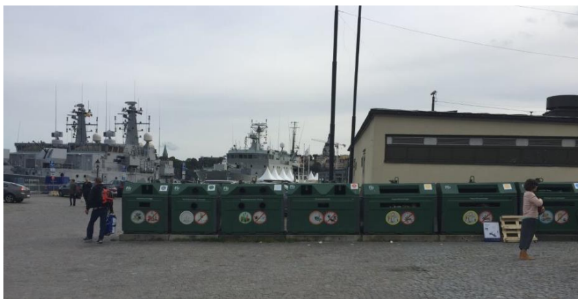
Källsortering på allmänplats norr om planområdet.

Källsortering finns 50 meter norr om tullhus 1..