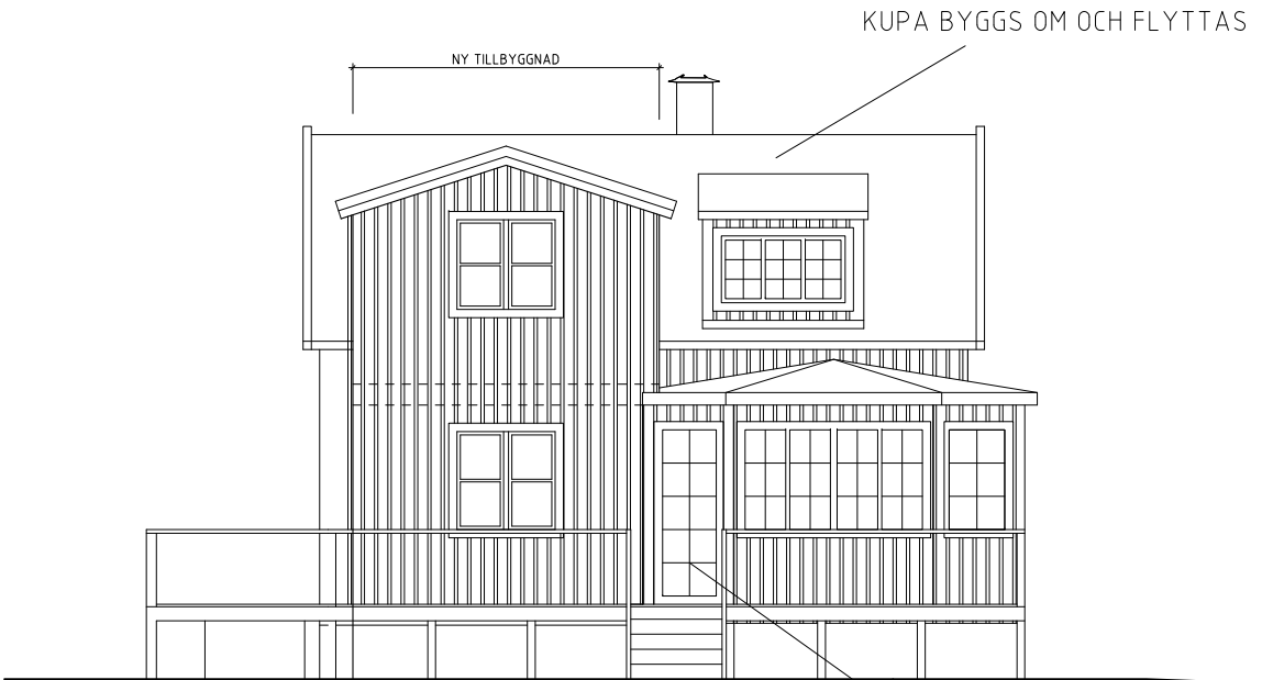
FASAD MOT TRÄDGÅRD

ETT FÖNSTER BYTS UT MOT GLASAD DÖRR TILL NY ALTAN