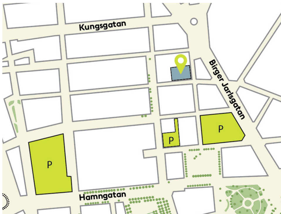
Placering av Hufvudstadens parkeringsgarage i närhet till kv. Vildmannen 7.

Sammanfattningsvis föreslås att kv. Vildmannen 7 löser behovet av 3 bilparkeringsplatser genom förhyrning av platser i närliggande parkeringsanläggningar, till exempel NK-Parkaden, Skären och Rännilen, se kartbild nedan. Dessa anläggningar ligger mellan 100 - 400 m från bostäderna och samtliga ägs av Hufvudstaden AB.