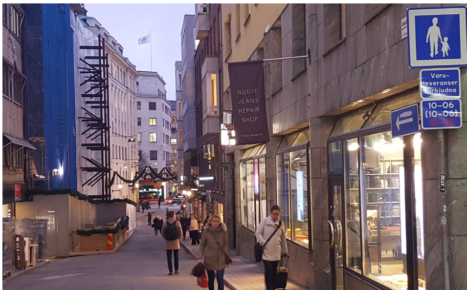
Jakobsbergsgatan är sedan 2017 en gågata.

År 2017 var gångflödet på Jakobsbergsgatan 10 000 per dygn och på Biblioteksgatan 22 000 gående per dygn förbi kv. Vildmannen 7. På Lästmakargatan promenerade 3000 gående per dygn och på Norrlandsgatan 13 000. Samtliga siffror redovisar vardagsmedeldygn, VDT. ( Gångflöde 2017 , Stockholms stad).