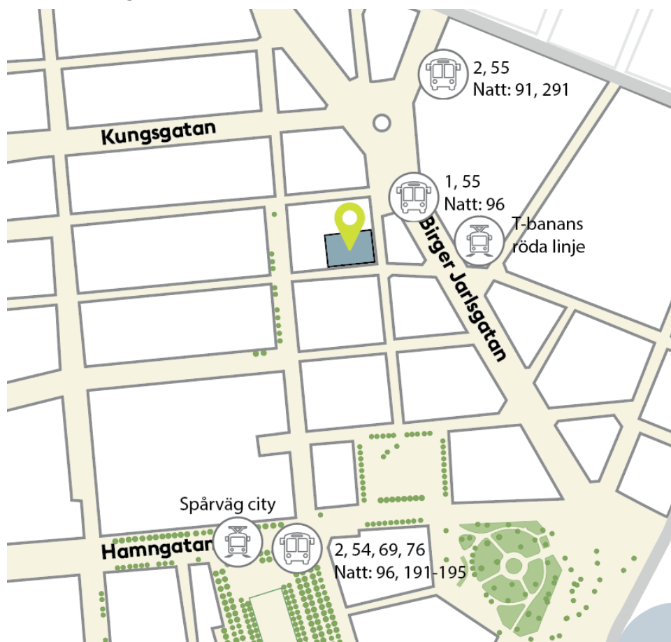
Kollektivtrafikhållplatser i närhet till kv. Vildmannen 7.

Det finns idag inget beslut om att genomföra en ytterligare förlängning av spårväg city mot Norra Djurgårdsstaden och Ropsten. Däremot pågår diskussioner och ett eventuellt besked om genomförande kan komma först sommaren 2019.