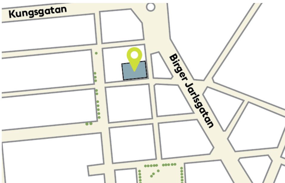
Läget för kv. Vildmannen 7 i Stockholm city, nära Stureplan.

Kv. Vildmannen är beläget i centrala Stockholm intill Stureplan, se karta nedan. Kvarteret omges av Biblioteksgatan i öster, Jakobsbergsgatan i söder, Norrlandsgatan i väster och Lästmakargatan i norr.