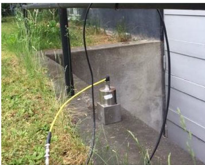
Figur 3. Mät punkt 2.