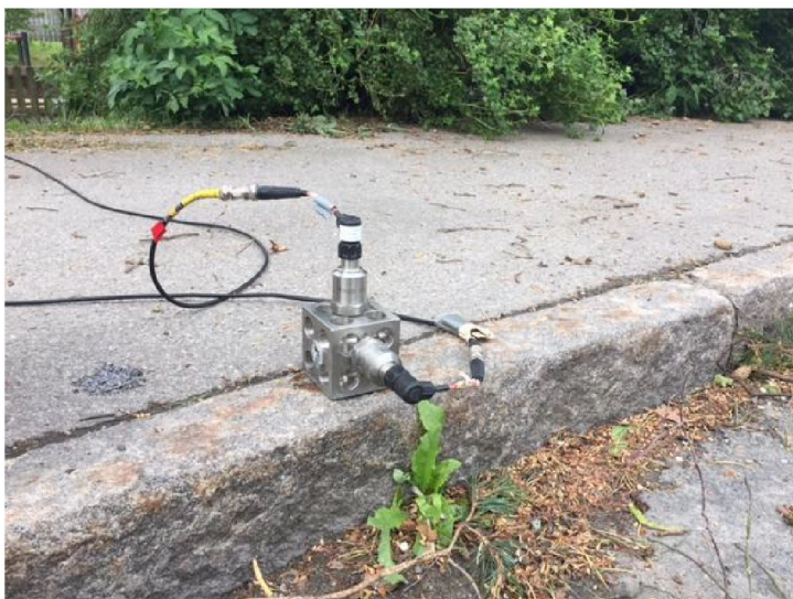
Figur 4. Mät punkt 3.