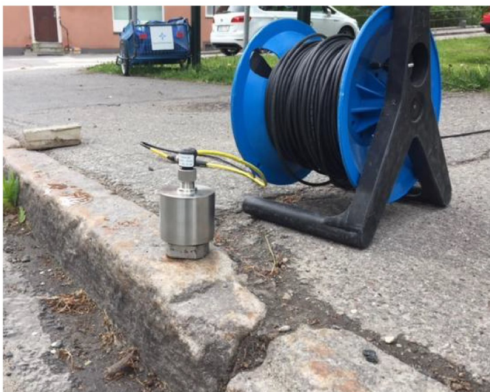
Figur 2. Mät punkt 1.