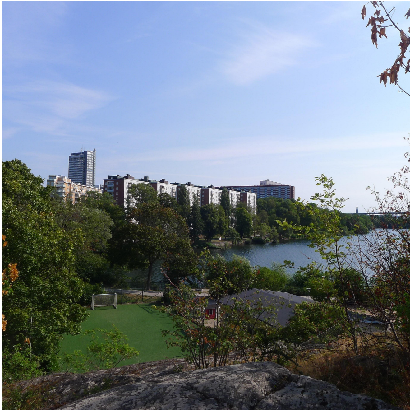
BEF UTSEENDE