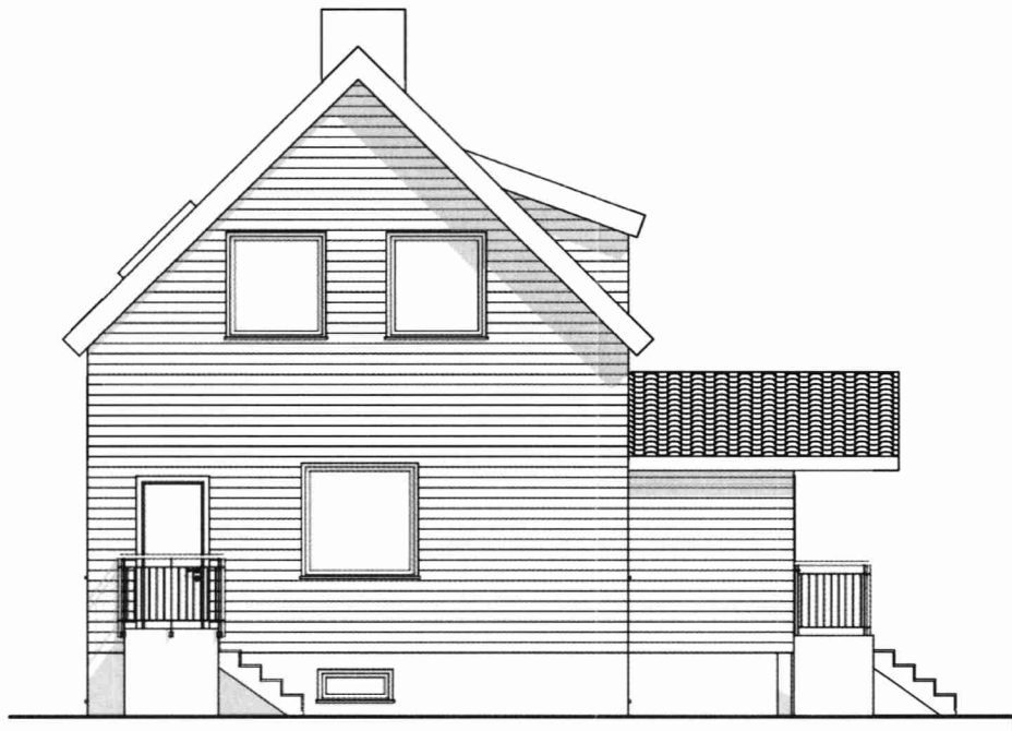
Fasad mot väst 1:100