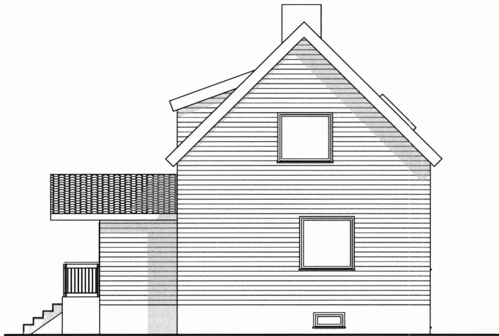
Fasad mot öst 1:100