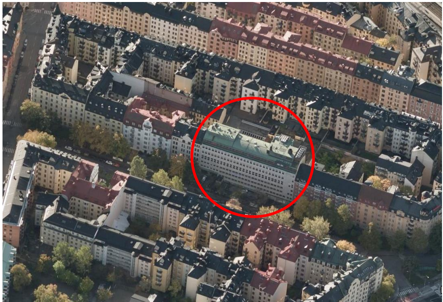
Planområdet markerat med röd ring.