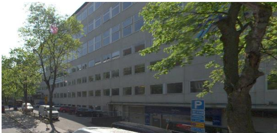
Fastighetens gatufasad och förgårdsmark mot Karlbergsvägen.