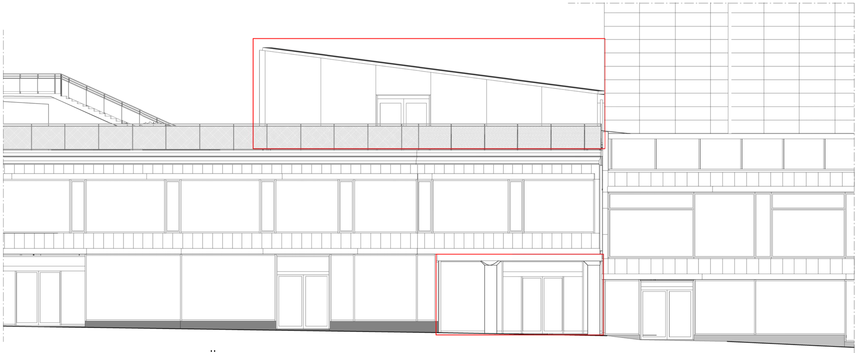
FASAD MOT SERGELGATAN, VÄSTER