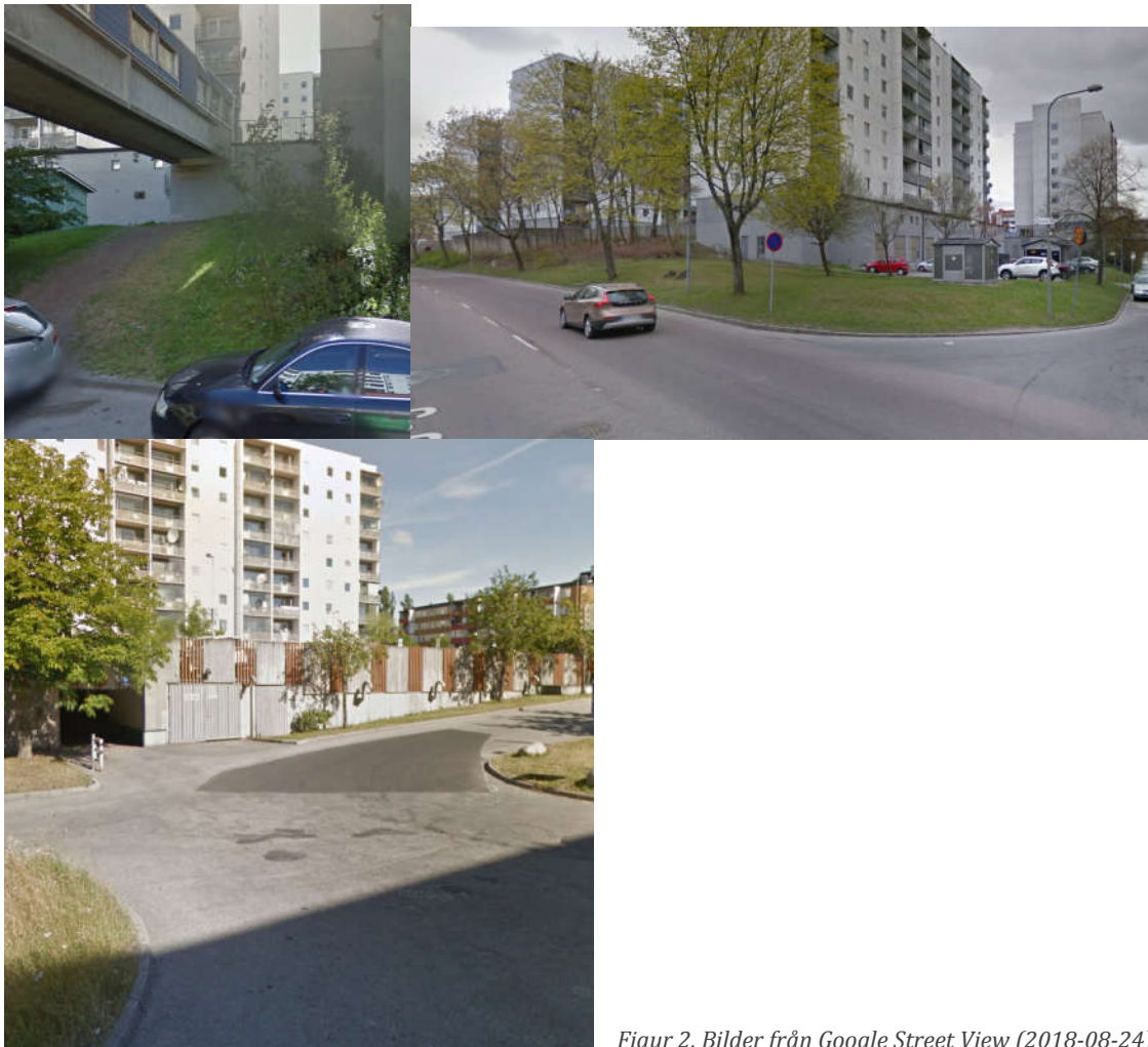
Figur 2. Bilder från Google Street View (2018-08-24).