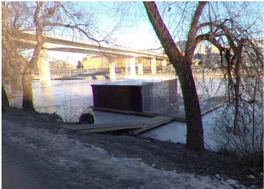
Vinterbild av aktuell brygga/förråd vid Kungsholms Strandstig, med Barnhusbron i fonden.