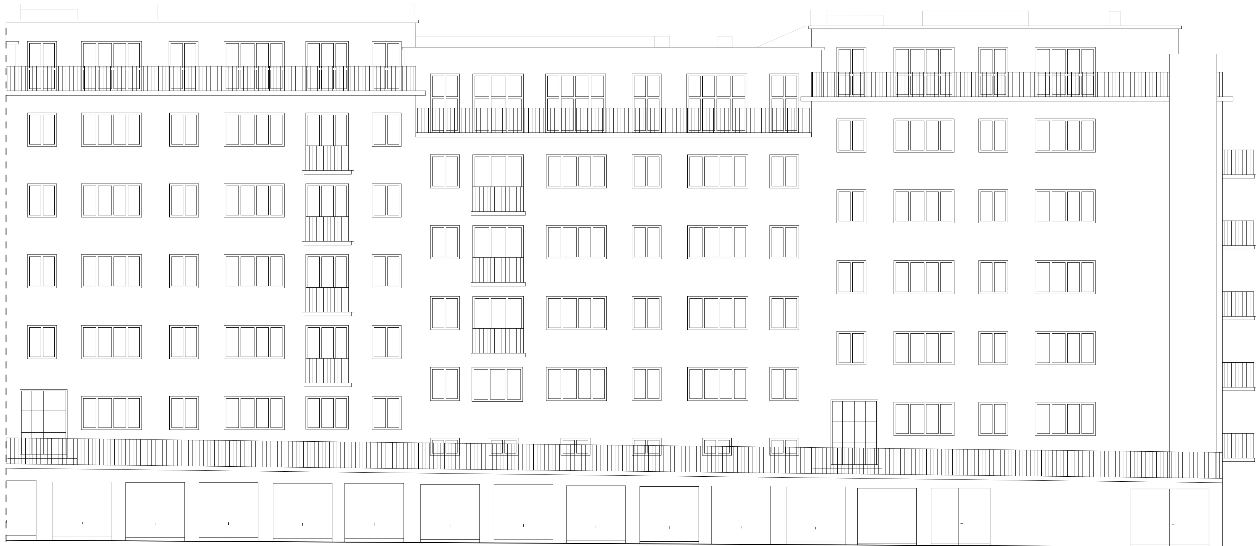
Mot väster Del 2