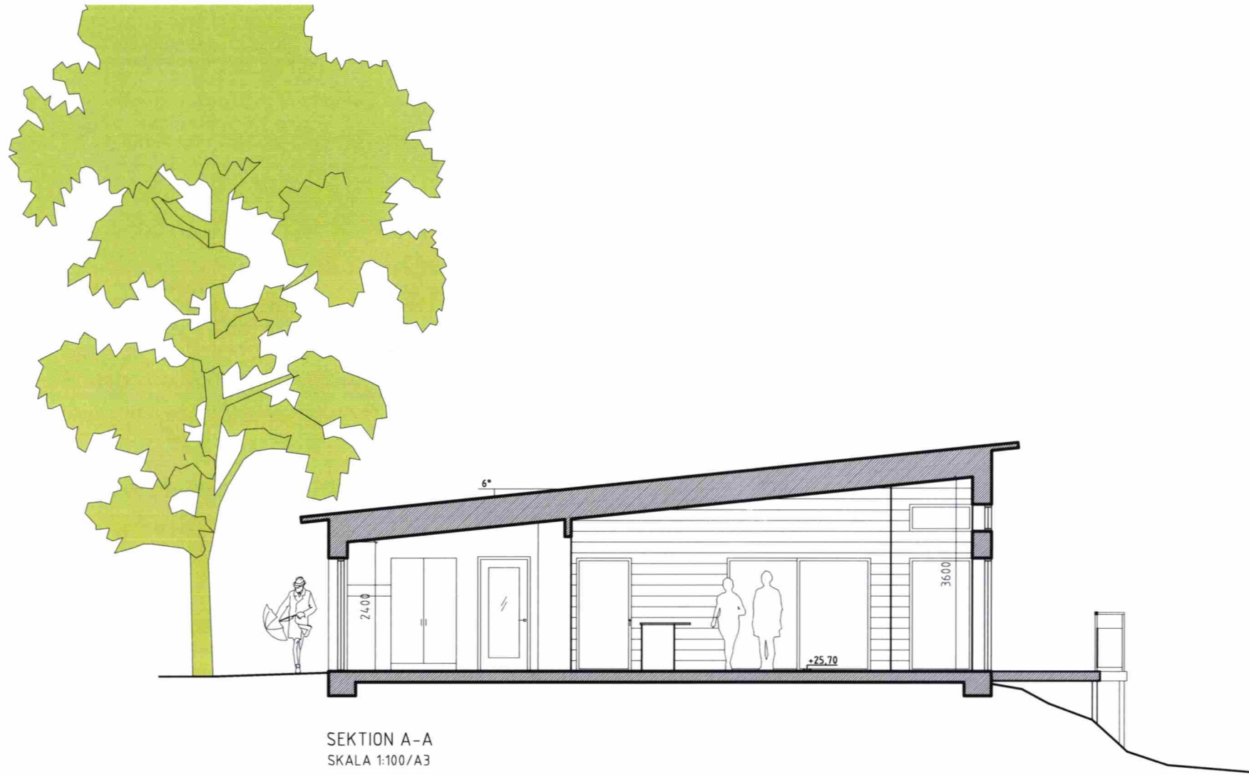
SEKTION A-A SKALA 1:100/A3

STOCKHOLM STAD Stadsbyggnadskontoret Inkom 2018 -10- 08 Reg. Dnr: 1 45 1 4 • 57 5