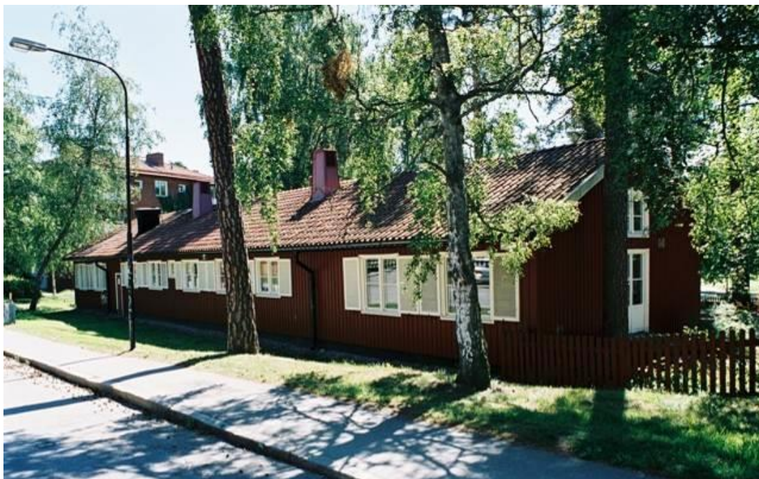
Vy från Grundtvigsgatan över den rivna barnstugan.