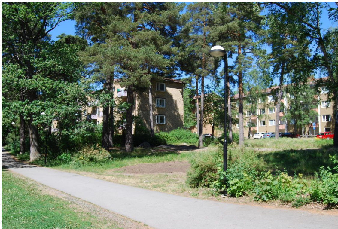
Förskoletomten mot norr med parkvägen i förgrunden.