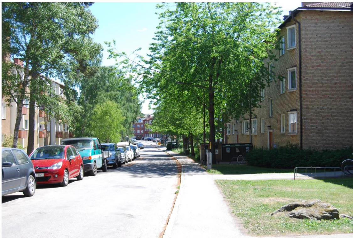
Grundtvigsgatan mot sydöst, Hälsingen 2 till höger. Bebyggelsen ligger indragen från gatan med gräsbevuxen förgårdsmark framför.