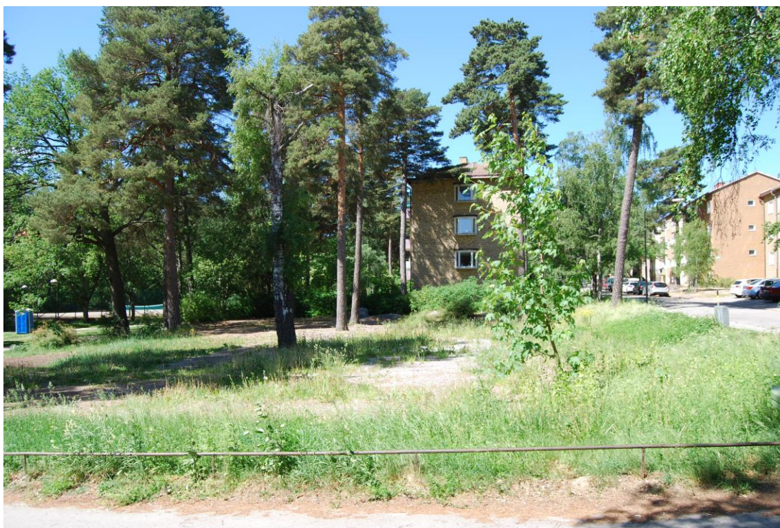
Förskoletomten mot nordväst, Grundtvigsgatan till höger i bild. Tomten sluttar svagt mot sydväst och parkstråket. Det finns flera mäktiga tallar på tomten.