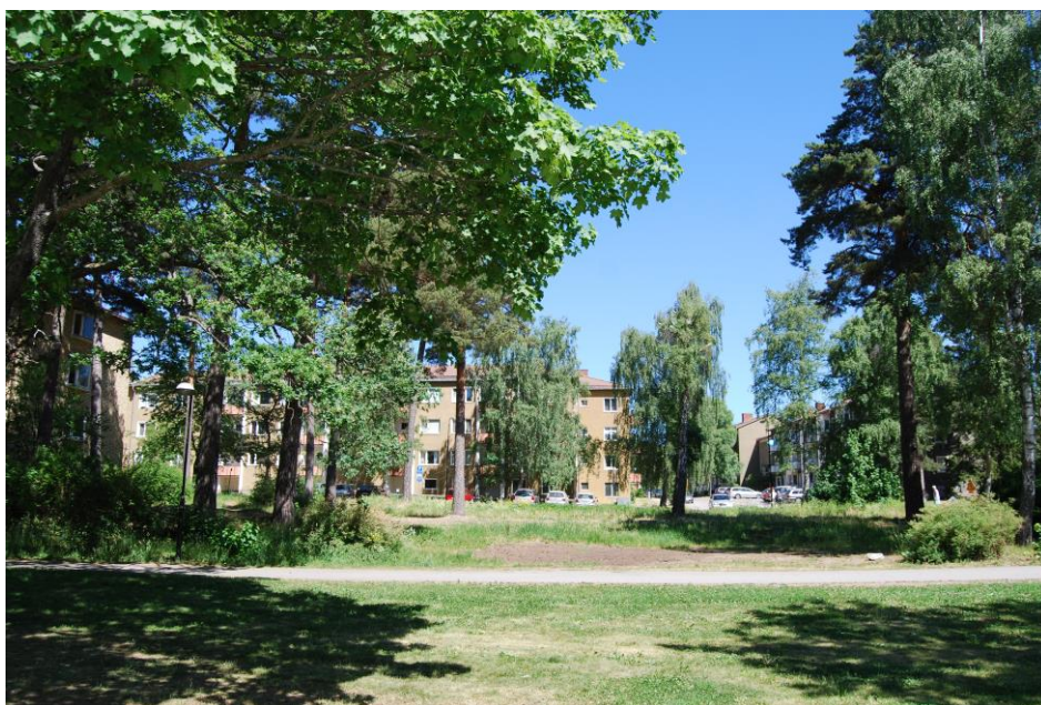
Förskoletomten mot nordost.