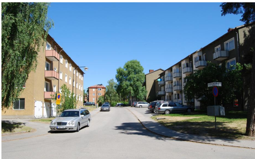
Korsningen Grundtvigsgatan-Kaj Munks väg. Kvarteren Upplänningen och Västgöten.