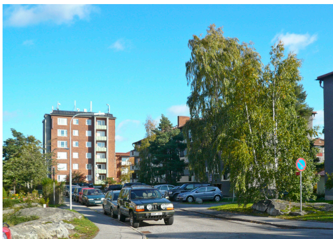
Punkthuset placerades ofta som fondmotiv. Här ett i tegel på Sigrid Undsets gata, som har karaktäristiskt sparad hållmark.