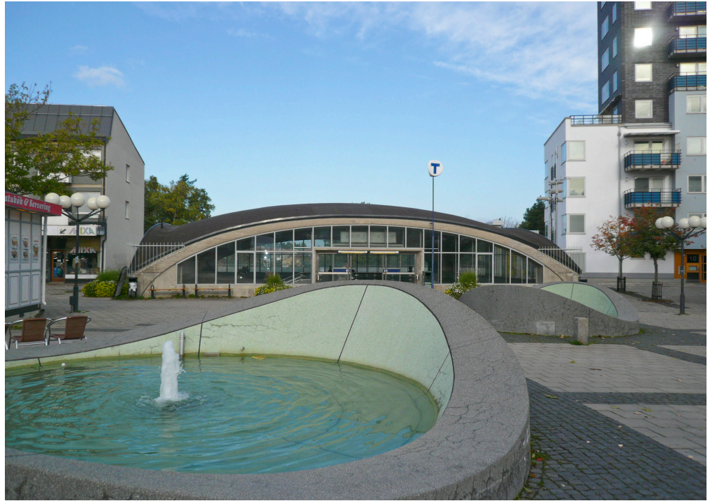
Blackebergs centrum med sin öppna, stensatta torgyta och den karaktäristiska välvda tunnelbanehallen och rundade fontänerna.