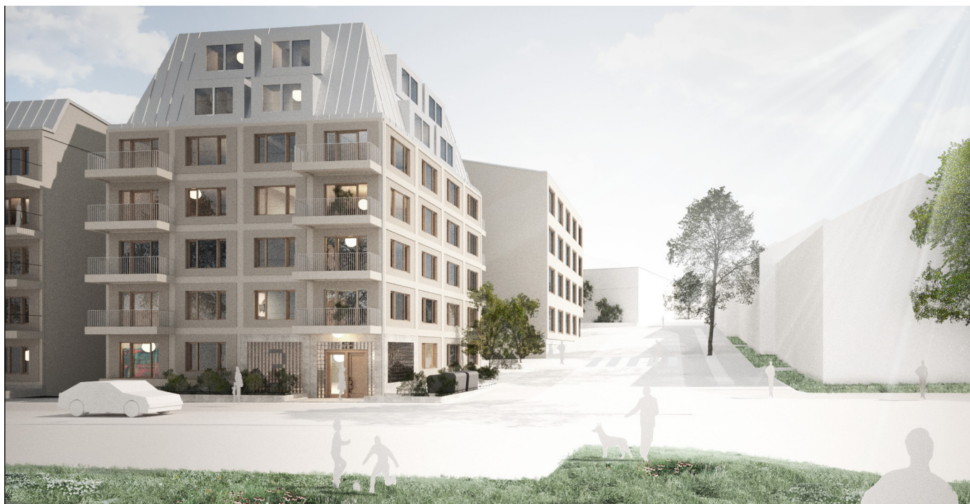
Illustration ur planförslaget. Vinjegatan har dragits om västerut för att byggnaderna i bild ska få plats.

Fortsatt utveckling av området bör verka för att tillvarata och utveckla platsbildningen vid Blackebergs torg som strategisk knutpunkt i området. Nya aktörer i den föreslagna bebyggelsen bör om möjligt komplettera snarare än konkurrera med befintliga verksamheter på torget.