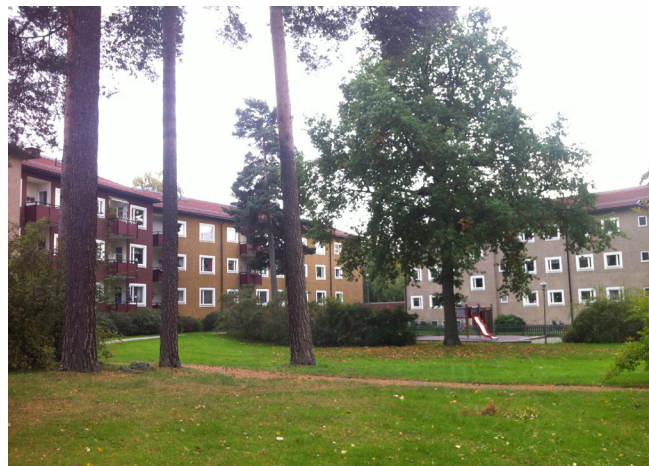
Karaktäristiskt grupperade smalhus runt stora gårdsrum med sparad naturmark i Blackeberg.

De ursprungliga planerna för Blackeberg domine-