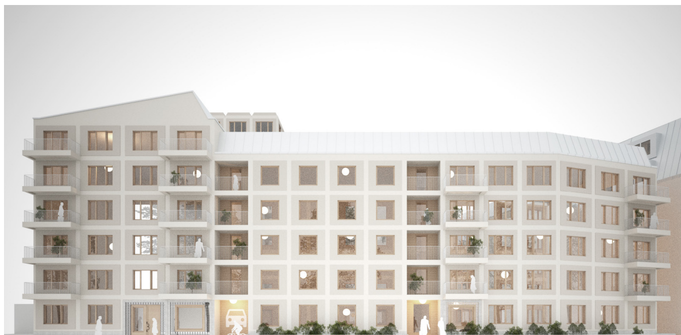
Illustration ur planförslaget. Fasad mot nordväst.

som beskrivs ovan. Då kvarteret kommer underbyggas med garage är dock möjligheten att förse den inre gården med större träd begränsad. Bostadsgården kommer vara avskild från den öppna gården; genom bostädernas läge i närheten till tunnelbanan samt i anslutning till en vårdcentral med viss folkgenomströmning får denna lösning anses vara motiverad, även om den avviker från Blackebergs plankaraktär.