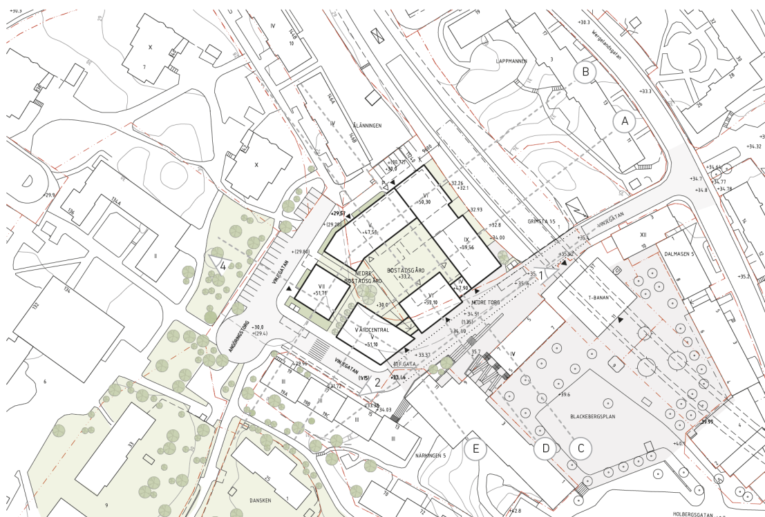
Situationsplan med förslaget inritat.