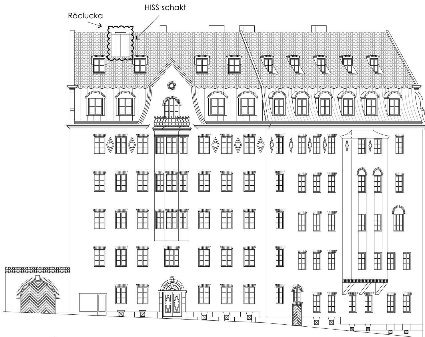
FASAD MOT ÖSTERMALMSGATAN 2