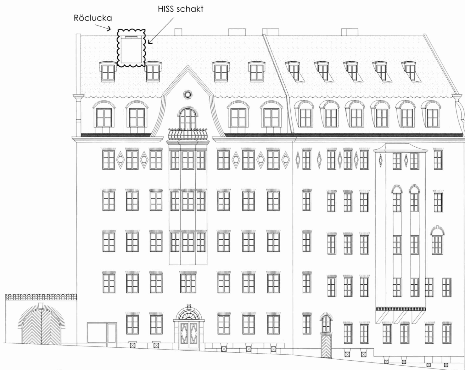
FASAD MOT ÖSTERMALMSGATAN 2