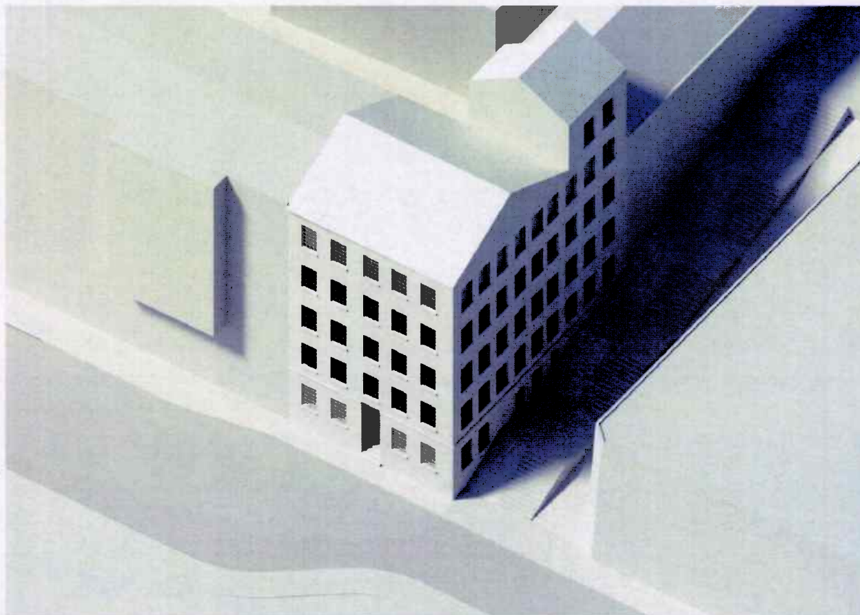
NY EXPLOATERING ENL GÄLLANDE DP

FÖRKLARINGAR ALLA MÅTT I MILLIMETER BOKSTÄVSRETECKNING AVSER LIKA MÅTT FÖRESKRIFTER HÄNVISNINGAR