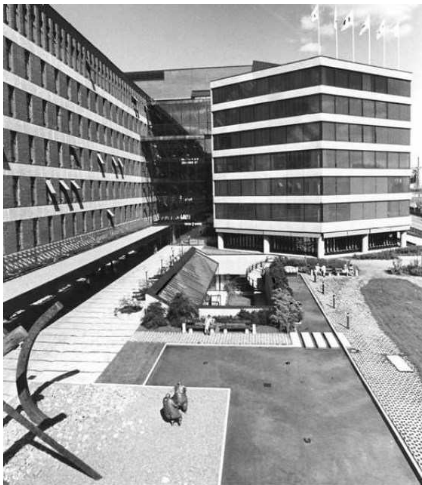
Den nybyggda anläggningen.

Kontorskomplexet i kvarteret Brädstapeln uppfördes för försäkringsbolaget Trygg-Hansa 1972-77. Arkitekt var Tengboms arkitektkontor. Gårdens parkanläggning anlades efter ritningar av stadsträdgårdsmästare Holger Blom.