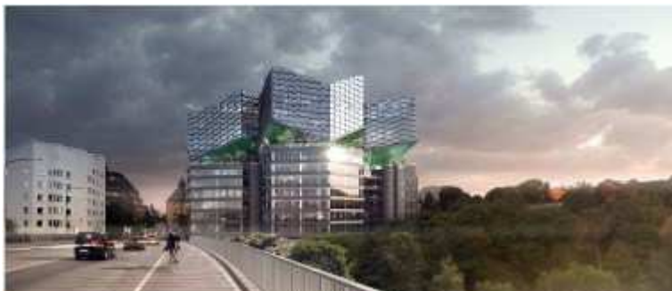
Föreslagen gestaltning från Barnhusbron.