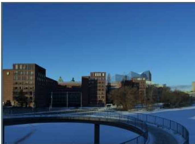
Vy från Kungsbron