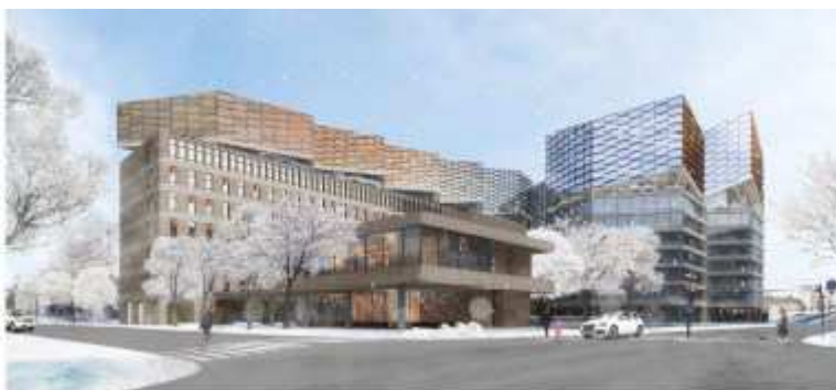
Föreslagen gestaltning sett från korsningen Flemminggatan Scheelegatan.

Påbyggnaderna har en prisma-liknande, skulptural form och skall ge sken av att sväva eller vara åtskilda från de befintliga byggnaderna. Även parken föreslås ändras mot Scheelegatan. Den mindre byggnaden, Paviljongen bevaras och byggs invändigt om och blir entré till det undre planet under den överbyggda gården där handel planeras. Bygglov till ombyggnaden har redan givits. Gården norr om Muttrarna byggs över. De befintliga byggnaderna ges skyddsbestämmelser för fasaderna och en del konstnärlig utsmyckning.