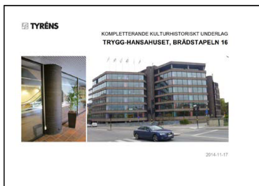
Kompletterande kulturmiljöunderlag Trygg-Hansahuset, Brädstapeln 16, Tyréns, 2014-11-17.