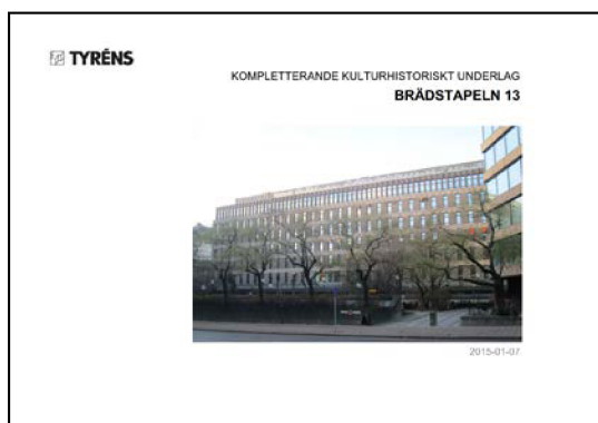
Kompletterande kulturmiljöunderlag Brädstapeln 13, Tyréns, 2015-01-07.