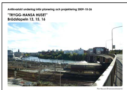
Antikvariskt underlag, Trygg-Hansa huset, Brädstapeln 13, 15, 16, Per Nelson Byggnadsvårdsbyrå, 2009-10-26.

Redovisningen bygger på de antikvariska undersökningar som gjorts sedan 2009. Dessa undersökningar är: