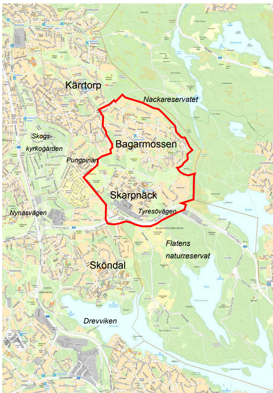
Programområdet med omgivning