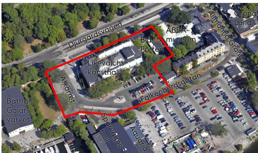
Planområdet på Södra Djurgården, sett från väster