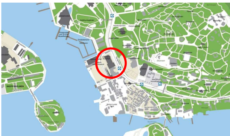
Kartöversikt. Planområdets läge markerat med röd ring.

Liljevalchs konsthall, som ägs av staden och drivs genom stadens kulturförvaltning, har genom beslut i kommunfullmäktige fått ekonomiska möjligheter att uppföra en ny utställningshall på parkeringsplatsen vid Falkenbergsgatan väster om den befintliga konsthallen.