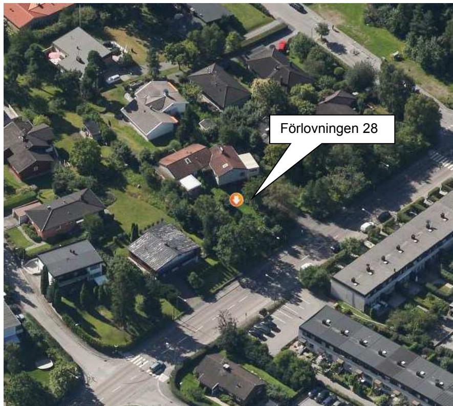
Snedbild över kvarteret Förlovningen