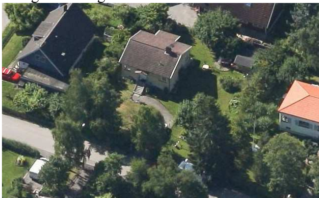
Bild som visar nuläget.

Fastigheten är belägen i Sundby och bebyggd med ett enplanshus med källare. Huset är idag placerat cirka 4 m från närmaste tomtgräns mot granne.