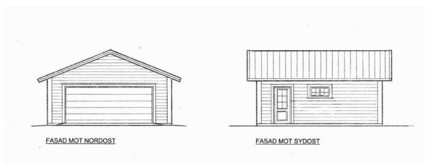
Fasad mot nordost och sydost