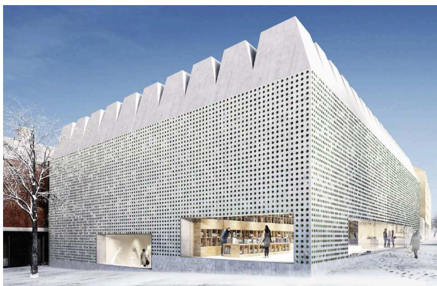
Fotomontage, fasad mot nordväst. Bild: Wingårdh Arkitektkontor AB

Kontoret bedömer att detaljplanens genomförande inte kan antas medföra sådan betydande miljöpåverkan som åsyftas i PBL 4 kap 34§ eller MB 6 kap 11§ att en miljöbedömning behöver göras.