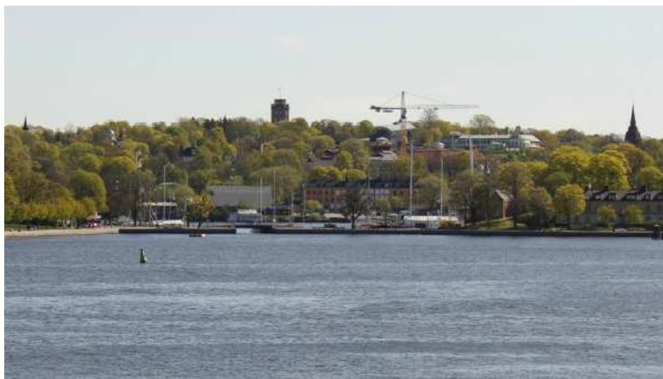
Vypunkt Slussen, den ljusa byggnaden är föreslagen konsthall.

Kontoret föreslår att planförslaget, efter att de föreslagna kompletteringarna införts i handlingarna, ställs ut för granskning.