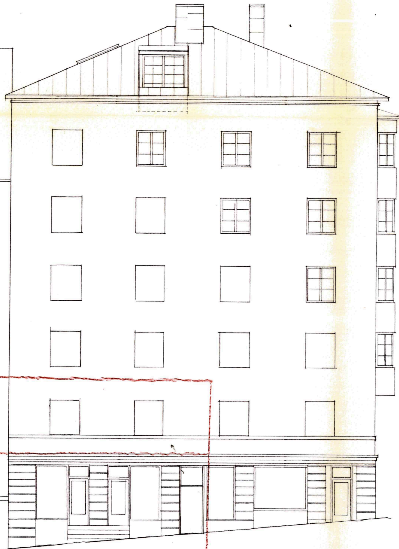
FASAD MOT BLECKTORNSGRÄND