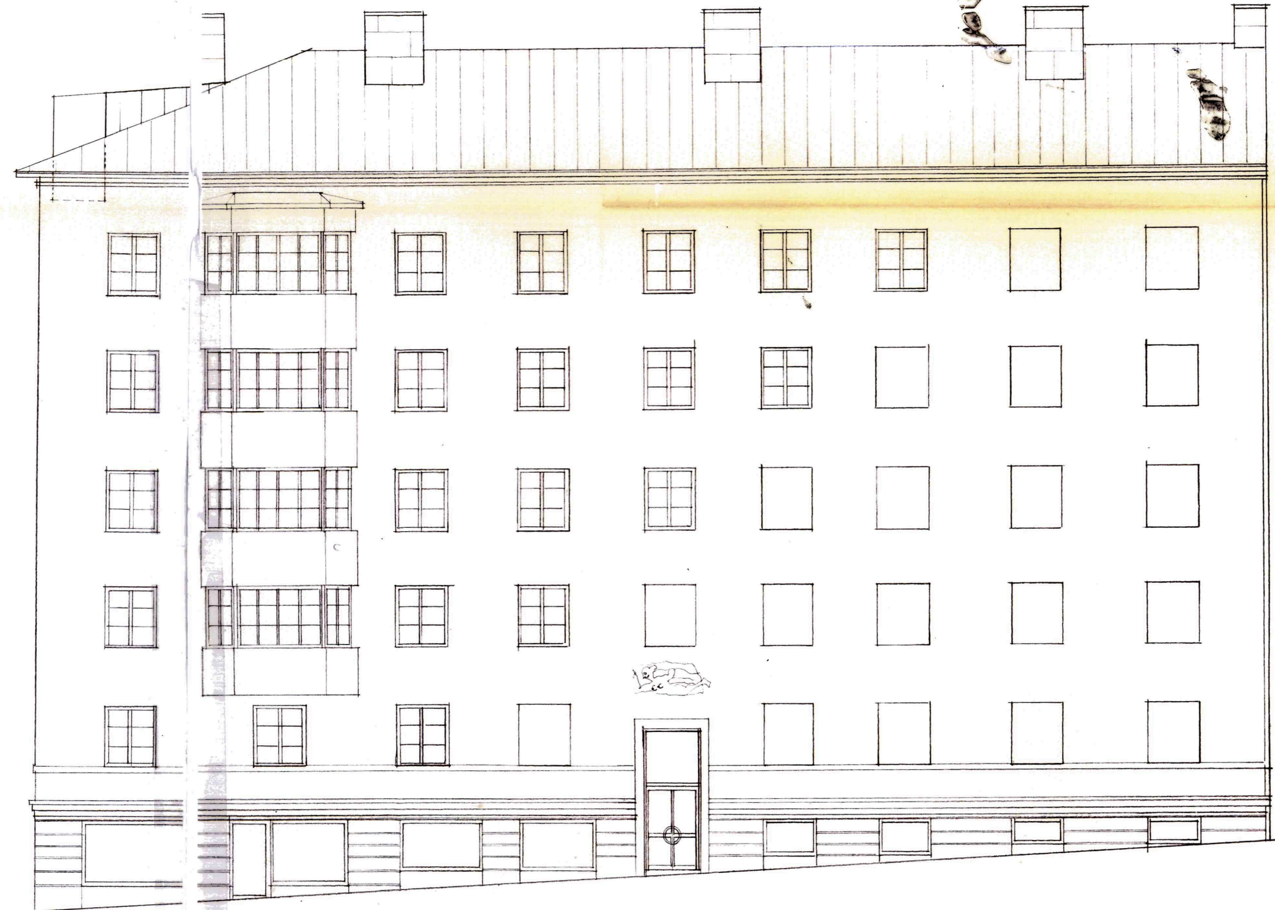
FASAD MOT BAS SATAN

STOCKHOLMS STAD Stadsbyggnadskontoret Inkom 2015-11-23 Reg. 19466-575 Dnr.