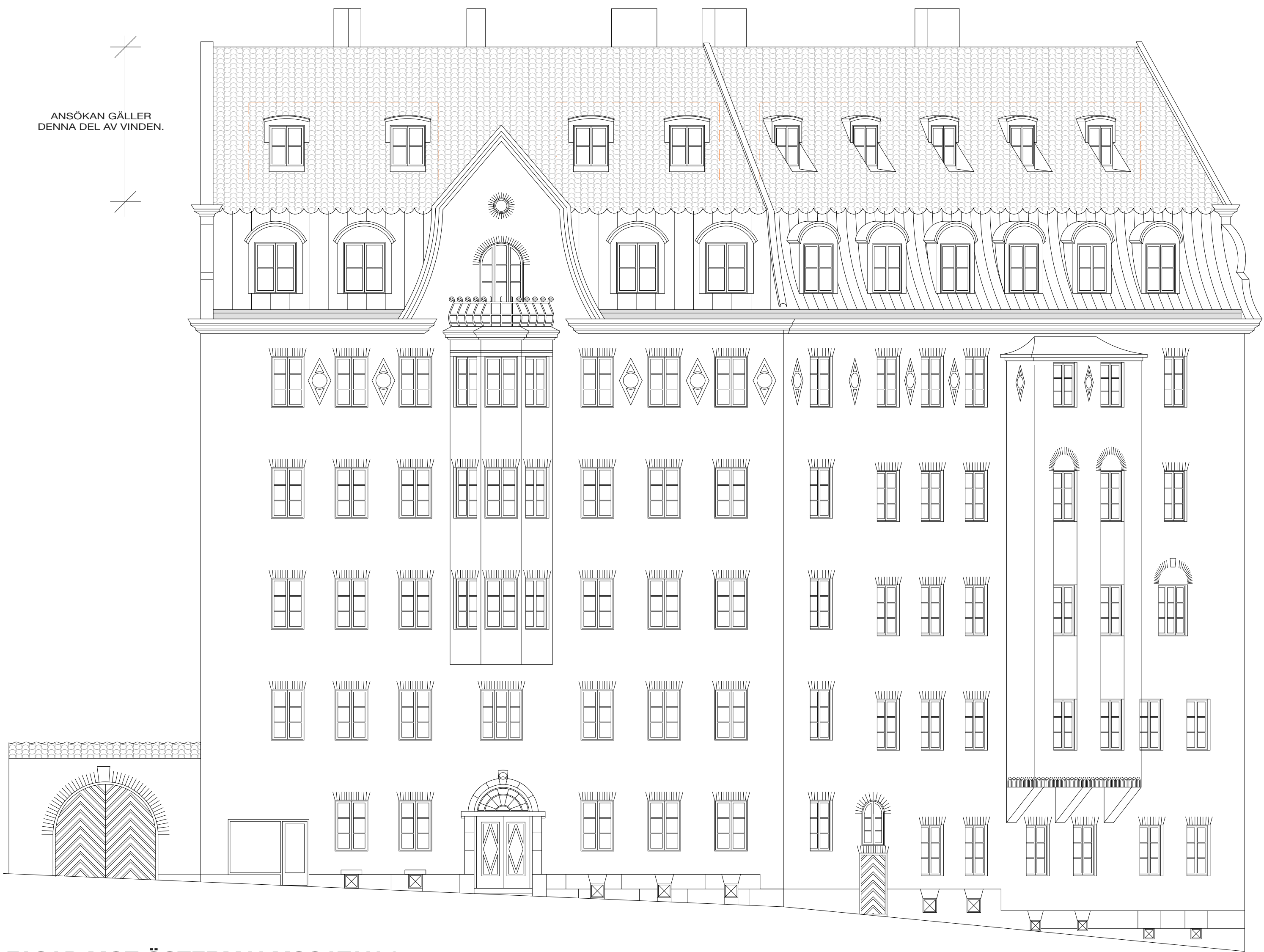
FASAD MOT ÖSTERMALMSGATAN 2