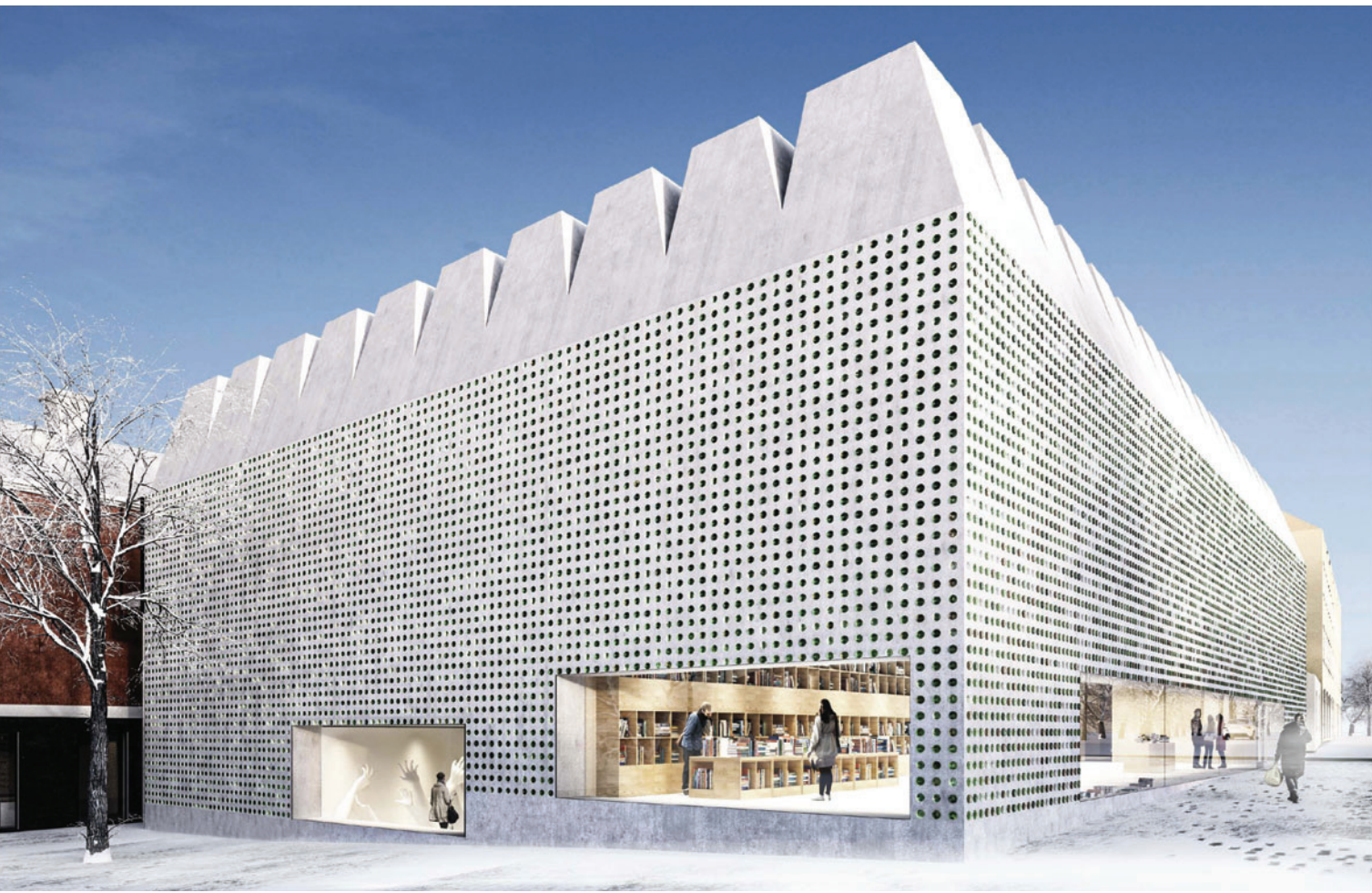
Tillbyggnaden sedd från Falkenbergsgatan.

Den nya utställningshallen har i höjd anpassat sig till Liljevalchs konsthall. Byggnaden är tillbakadragen så att Liljevalchs norra stora utställningshall fortsatt är huvudnumret i stadsrummet. En del av Liljevalchs västra fasad byggs för i samband med nybygget. Byggnaderna kopplas samman, nya utrymmen för museishop och café skapas, en ny entré öppnas mot Falkenbergsgatan och Blå Porten. Den planerade konsthallen har en ljus betongfasad perforerad av glas och en karakteristisk takutformning som genom lanterniner skapar överljus till den övre utställningsvåningen. Den gränd som skapas i söder ska ge utrymme för in- och urlastning för Abbamuseet/hotellet, Blå Portens kök och Stadsholmens bostadshus. Möjligheten att ta delar av servitutsområdet i anspråk provas under planprocessen. Mot Alkärret i norr finns möjligheter för en mindre platsbildning, t.ex. ett skulpturtorg.