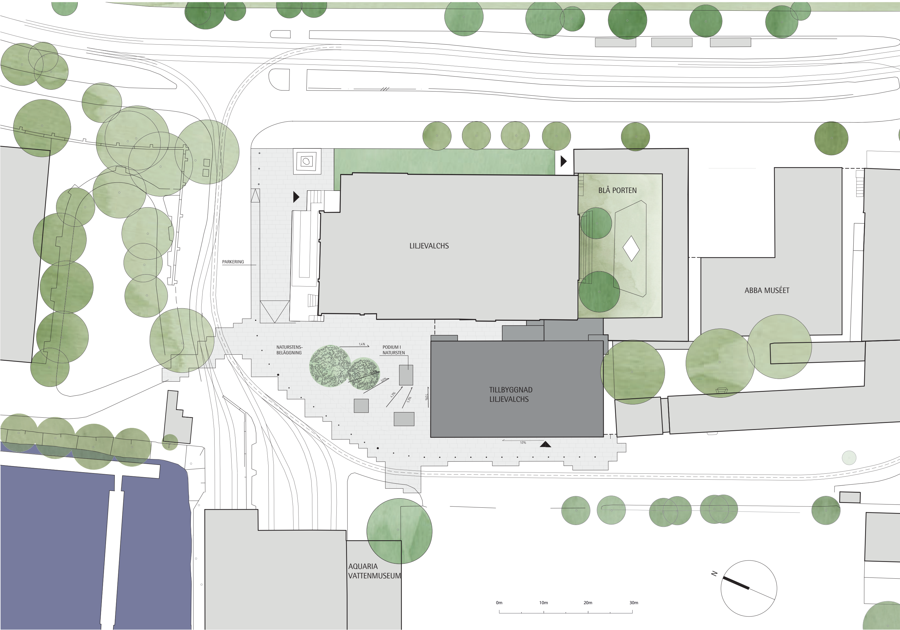
Situationsplan. Ny tillbyggnad i mörkgrått. Bild: Wingårdhs