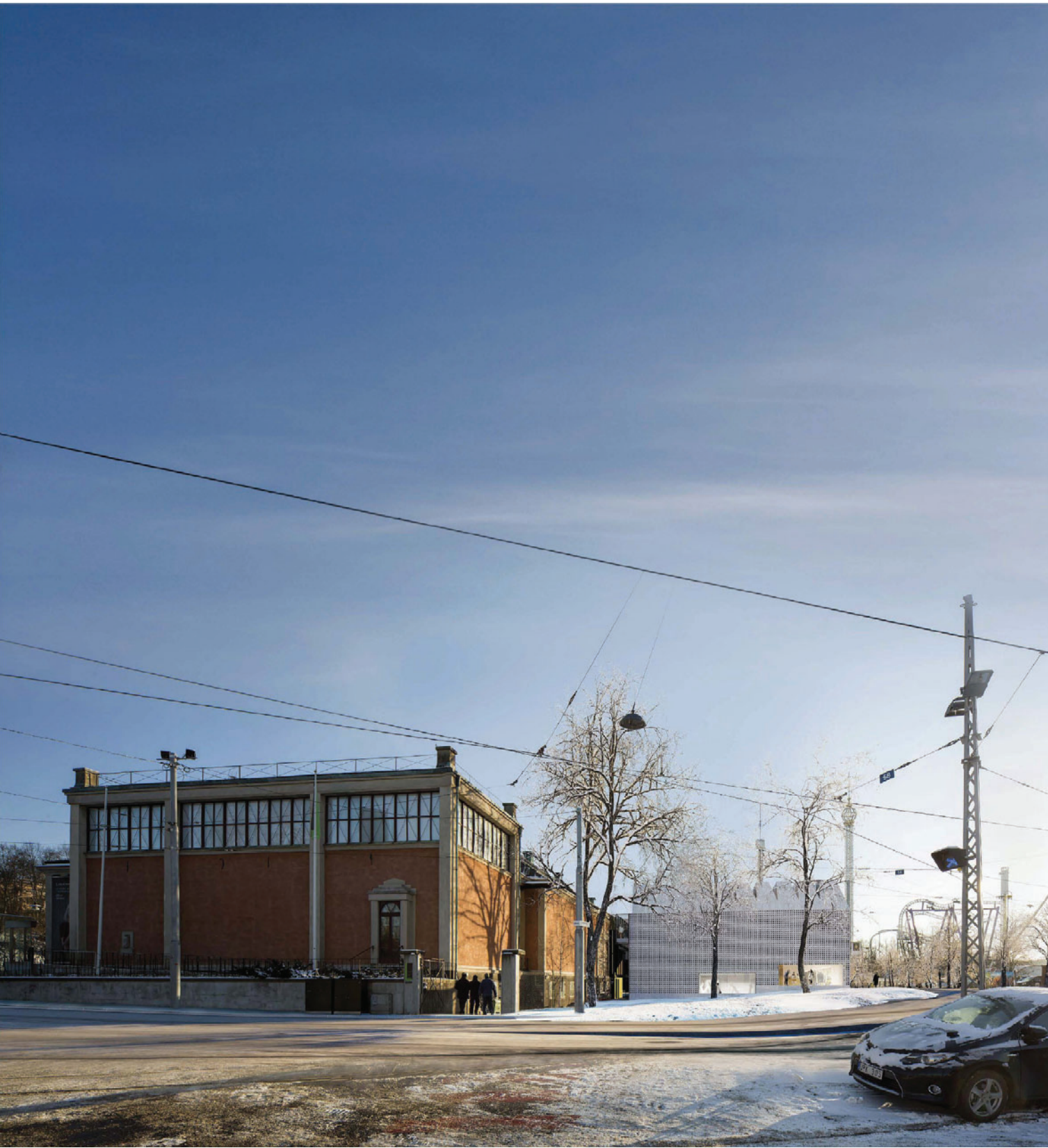
Tillbyggnaden sedd från Alkärret.