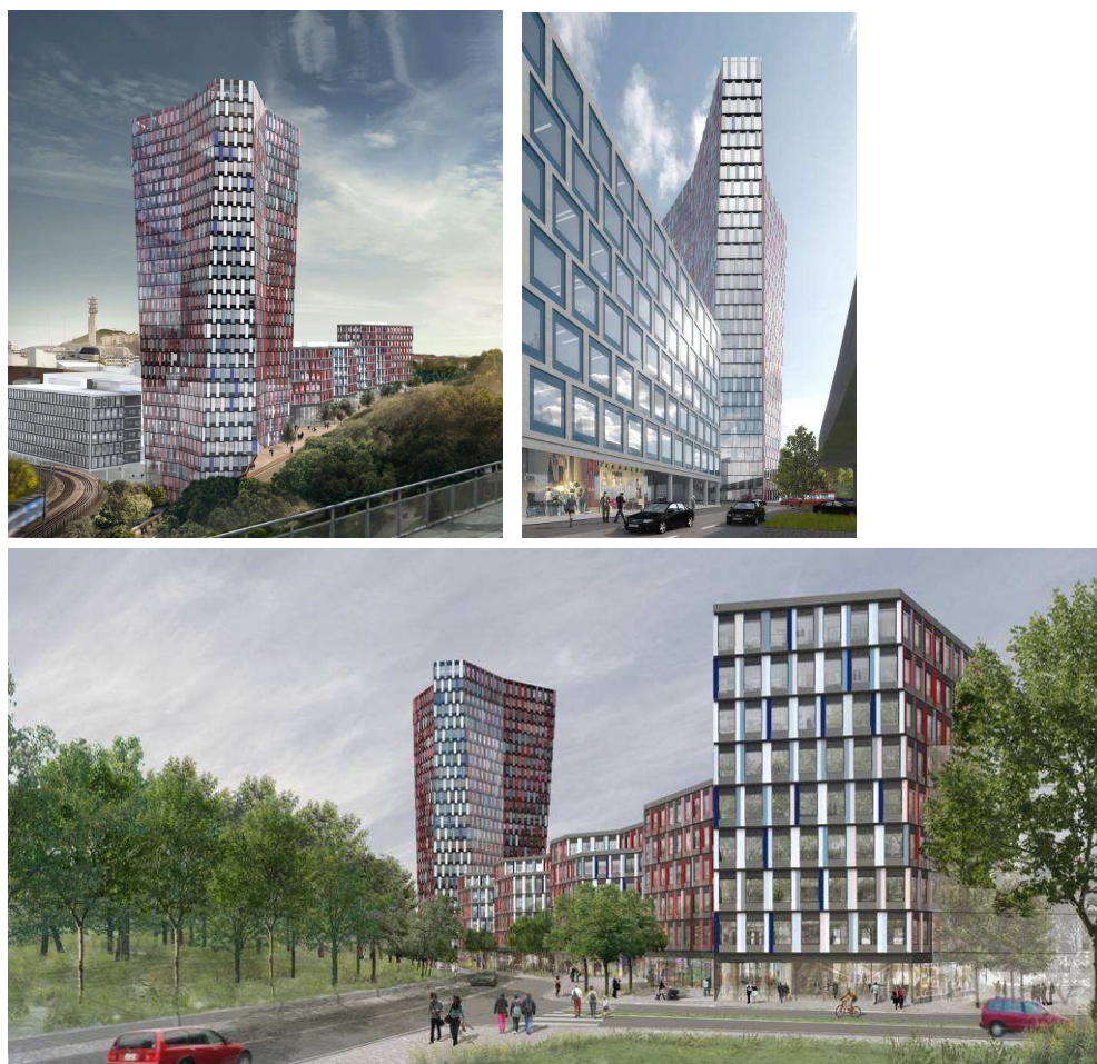
Illustrationer över kontorsbebyggelsen från Hammarbybacken söderut. Illustration: Sauerbruch Hutton

För att ge fotgängare en bättre koppling mellan Gullmarsplans tunnelbanestation och Hammarby Allé lämnas ett släpp söder om det höga huset. Detta ger också ett visuellt samband mellan Hammarbybacken och Mårtensdal, med Sofia kyrka på söder, i bakgrunden. En trappa förbinder Hammarbybacken och Hammarby Allé. Denna förbindelse gör det lättare att hitta trots stora nivåskillnader och gör promenaden mellan tunnelbanestationen och Hammarby Allé mer direkt. Publika verksamheter ska inrymmas i kontorshusens bottenplan för att skapa aktiva gatumiljöer.