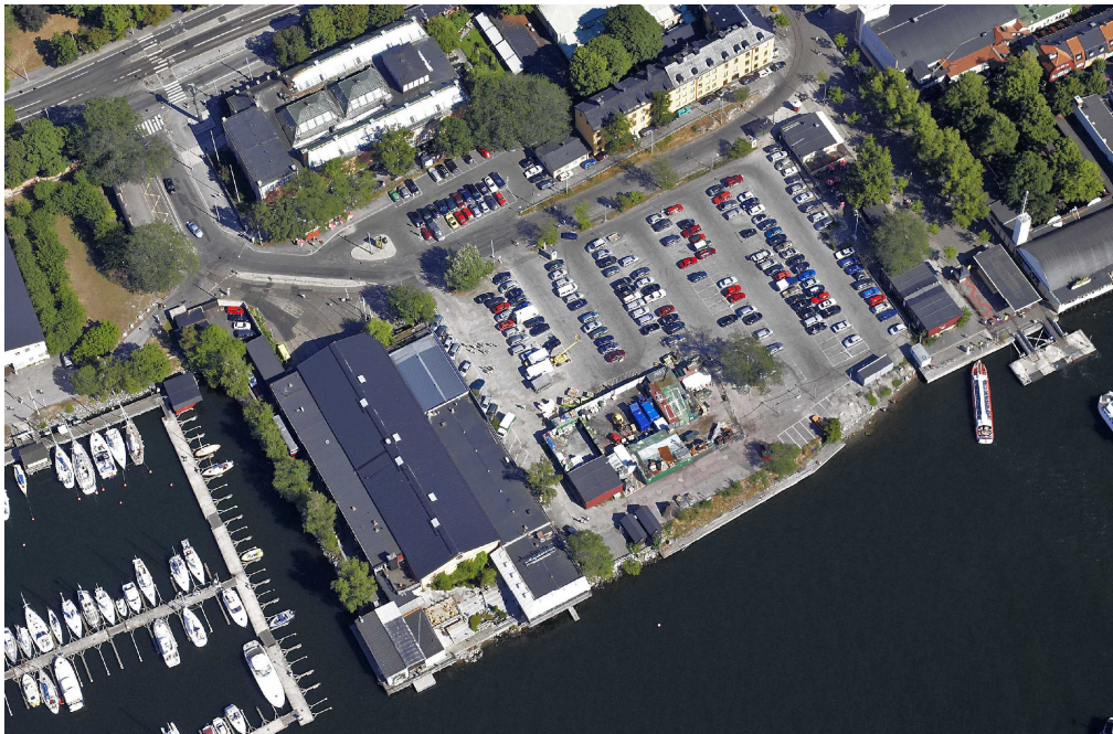
Liljevalchs med parkering i övre vänstra hörnet

Evenemangsparken på västra delen av Södra Djurgården är en av världens tio mest besökta evenemangs- och temaparker. I århundraden har området varit en av stadens främsta besöksmål. En översiktsplan för stadens del av den Kungliga Nationalstadsparken – Djurgården - antogs av kommunfullmäktige 2009. I översiktsplanen definieras Evenemangsparken som ett mer bebyggt och anlagt område. Där ska befintliga verksamheter kunna vidareutvecklas och förnyas för att området ska kunna behålla sin attraktivitet. Det framhålls att "Områden vid „Skeppsholmsviken är exempel på platser som med fördel kan förändras" (kv Skeppsholmen ligger mitt emot kv Konsthallen). Gällande stadsplan från 1950-talet för kv Konsthallen 3 anger konstateljeer. Stadsbyggnadskontoret konstaterar att en ny konsthall vid Falkenbergsgatan får anses förenligt med nämnda översiktsplan.