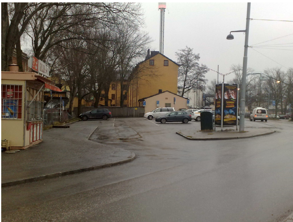
Konsthallen 3 med parkering och Falkenbergsgatan till höger

Rådande förhållande vid Falkenbergsgatan med stora parkeringsytor, trasiga trafikytor och en del tillfälliga byggnader, tillhör det minst tilltalande inom Evenemangsparken. I det vilande planförslaget för kv Skeppsholmen ingår en två våningar hög huslänga som ramar in Gröna Lunds tänkta utvidgning. Falkenbergsgatan avses bli ett förlängt huvudstråk för främst gående längs vattnet från Galärvarvsområdet och vidare via Lilla Allmänna Gränd ned till Beckholmssundet. En ny karaktärsbyggnad - konstannexet - skulle förstärka och lyfta detta stråk. För att ytterligare höja de stadsmässiga kvaliteterna vid Liljevalchs/Falkenbergsgatan bör på sikt dagens röriga trafikområde vid Alkärrret genomkorsat av refuger och spår ersättas av en värdig entréplats till ett av Södra Djurgårdens mest besökta delområden.