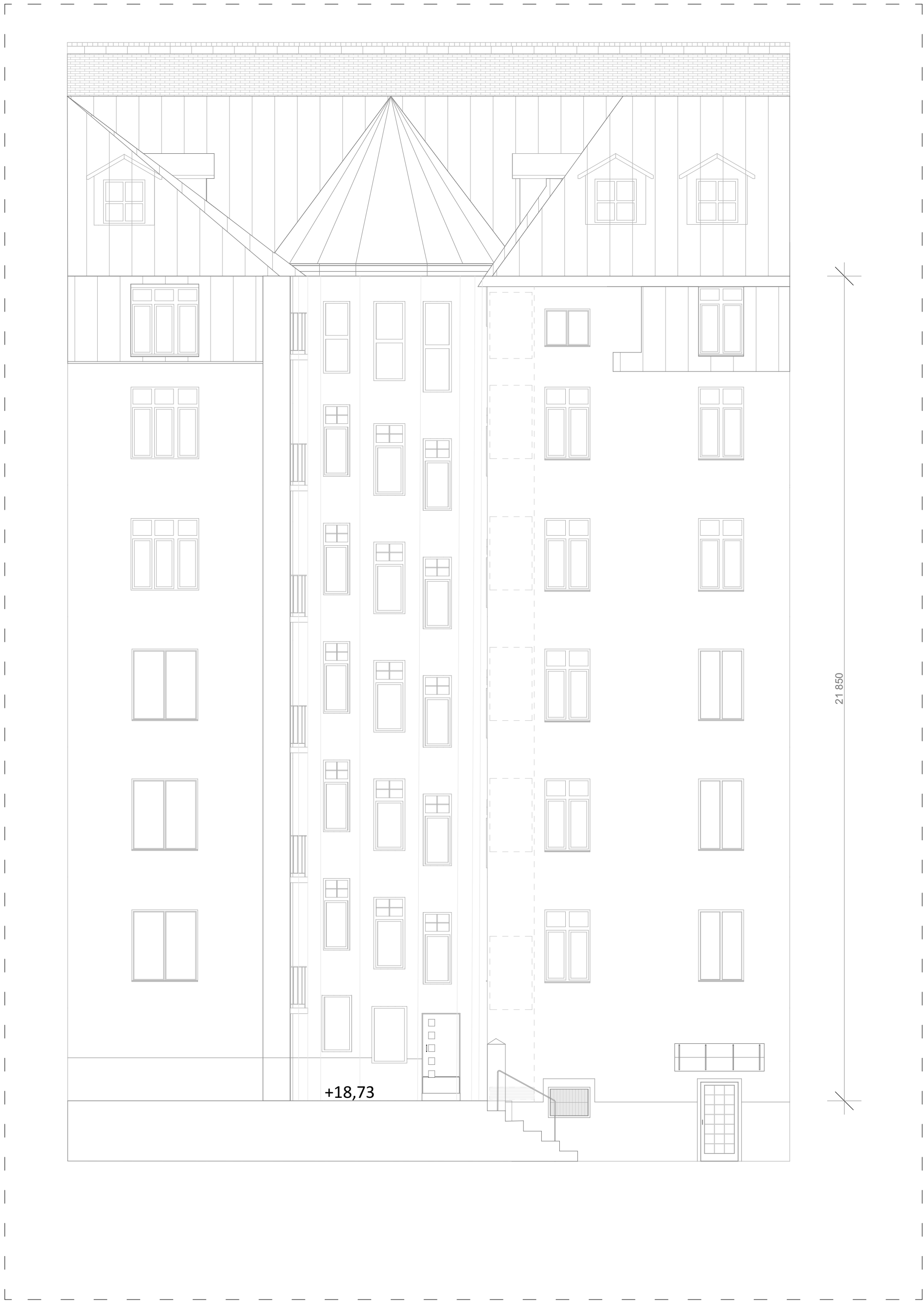
FASAD MOT GÄRD 1:100

RITNINGAR SKALL, FÖR ATT VARA GÄLLANDE PÅ BYGGARBETSPÅTSEN ELLER FÖR ATT ANVÄNDAS FÖR BESTÄLLNING AV SNICKERIER, INREDNING M.M. VARA FÖRSEDD MED BENÄMNING "BYGGHANDLING". SAMTLIGA MÅTT KONTROLLERAS PÅ PLATS INNAN TILLVERKNING SKER. ENTREPRENÖREN SKALL FÖRSÄKRA SIG OM ATT HEN ERHÅLLIT DEN SENASTE VERSIONEN AV RITNINGEN INNAN ARBETE PÅBÖRJAS. VID EVENTUELLA OKLARHETER; KONTAKTA ARKITEKTEN.