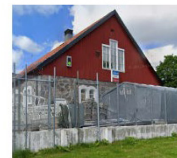
BEFINTLIG FASAD MOT NORDÖST