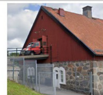
BEFINTLIG FASAD MOT SYDVÄST