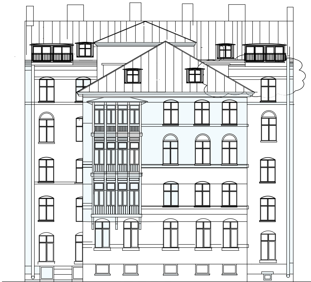
FASAD MOT GÅRD . ÖSTER Alternativ med altaner mot gården Samt kupor på gårdshuset