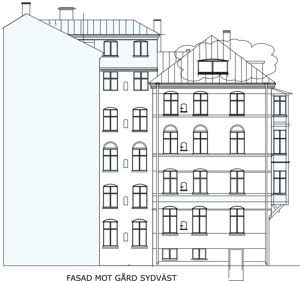
FASAD MOT GÅRD SYDVÄST