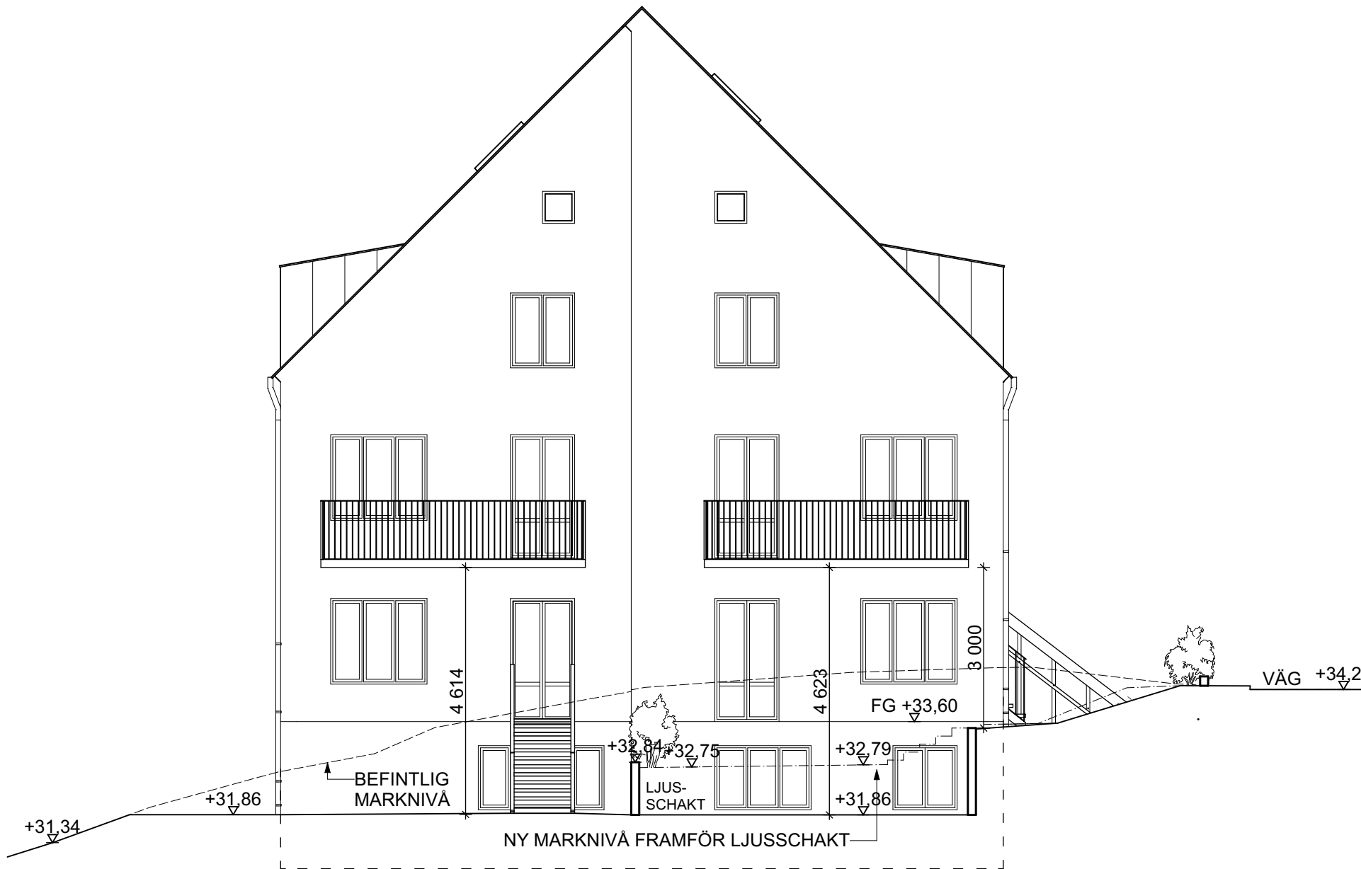
A4 - FASAD MOT SYDVÄST