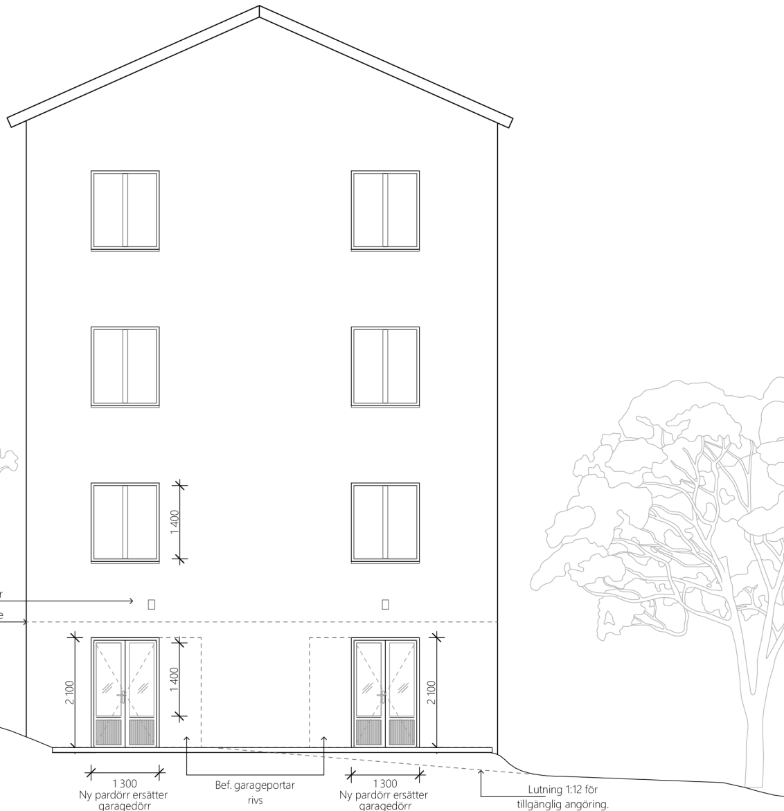
FASAD MOT NORDOST