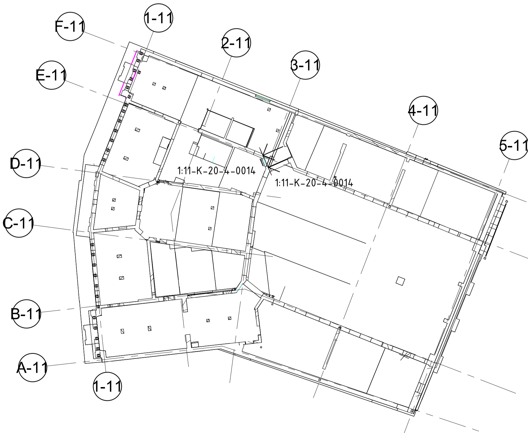
2 SKALA 1 : 250 ÖVERSIKTSPLAN ELEVATIONER