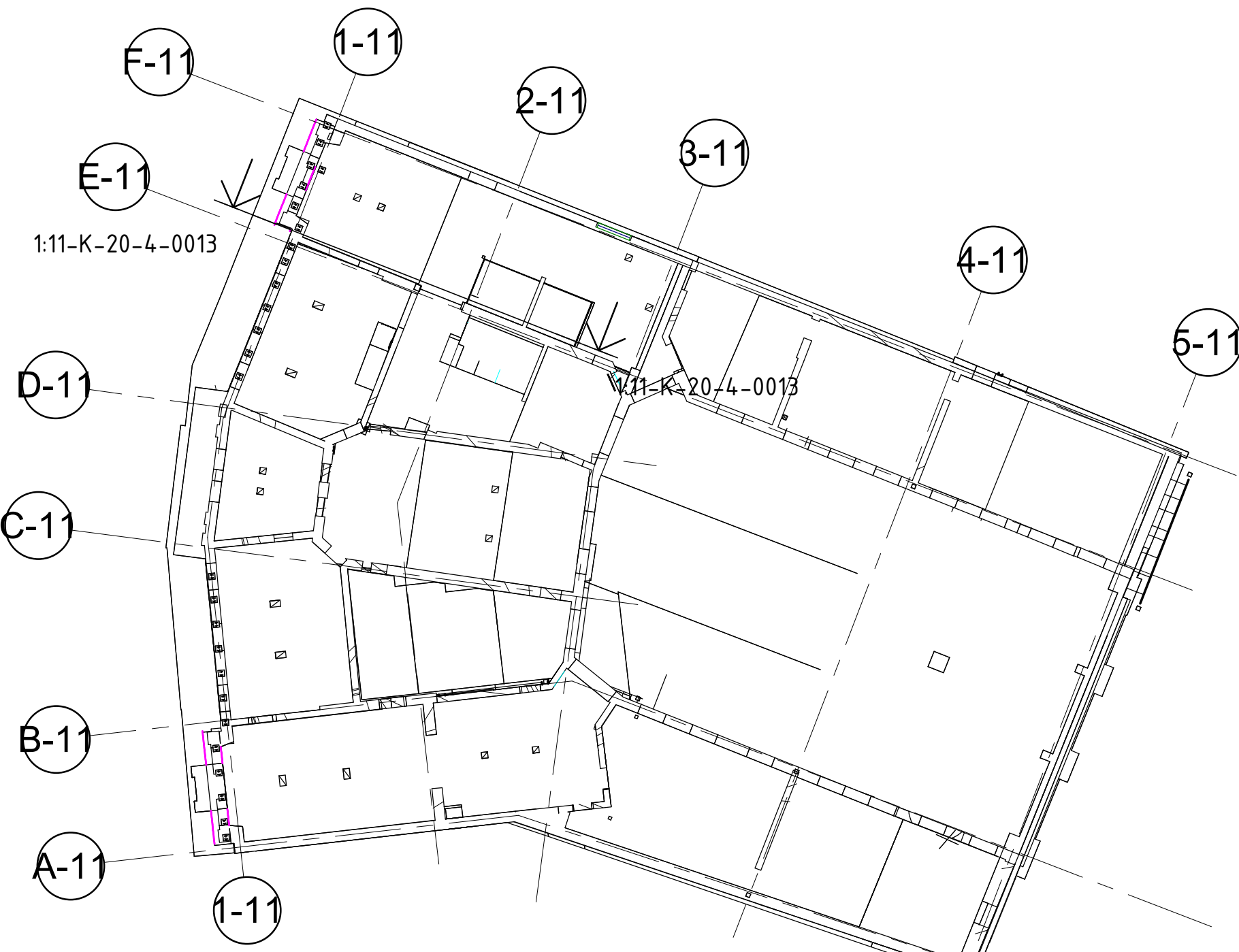
2 SKALA 1 : 250 ÖVERSIKTSPLAN ELEVATIONER