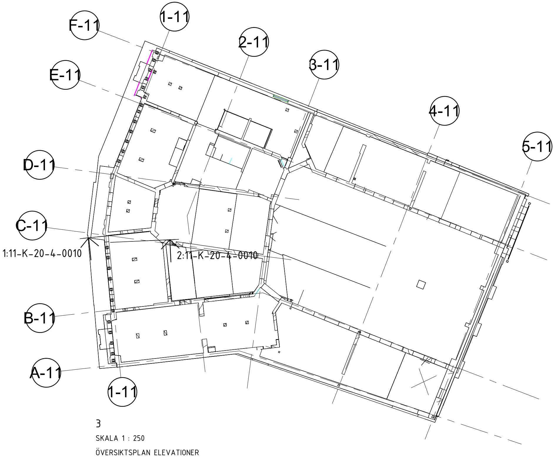
3 SKALA 1 : 250 ÖVERSIKTSPLAN ELEVATIONER