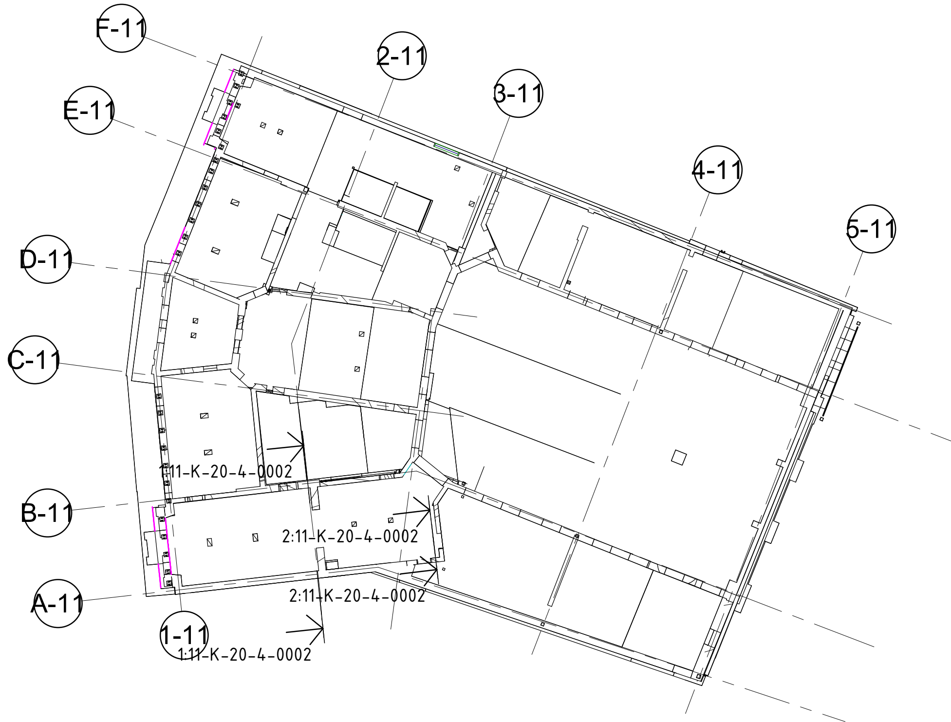
3 SKALA 1 : 250 ÖVERSIKTSPLAN ELEVATIONER