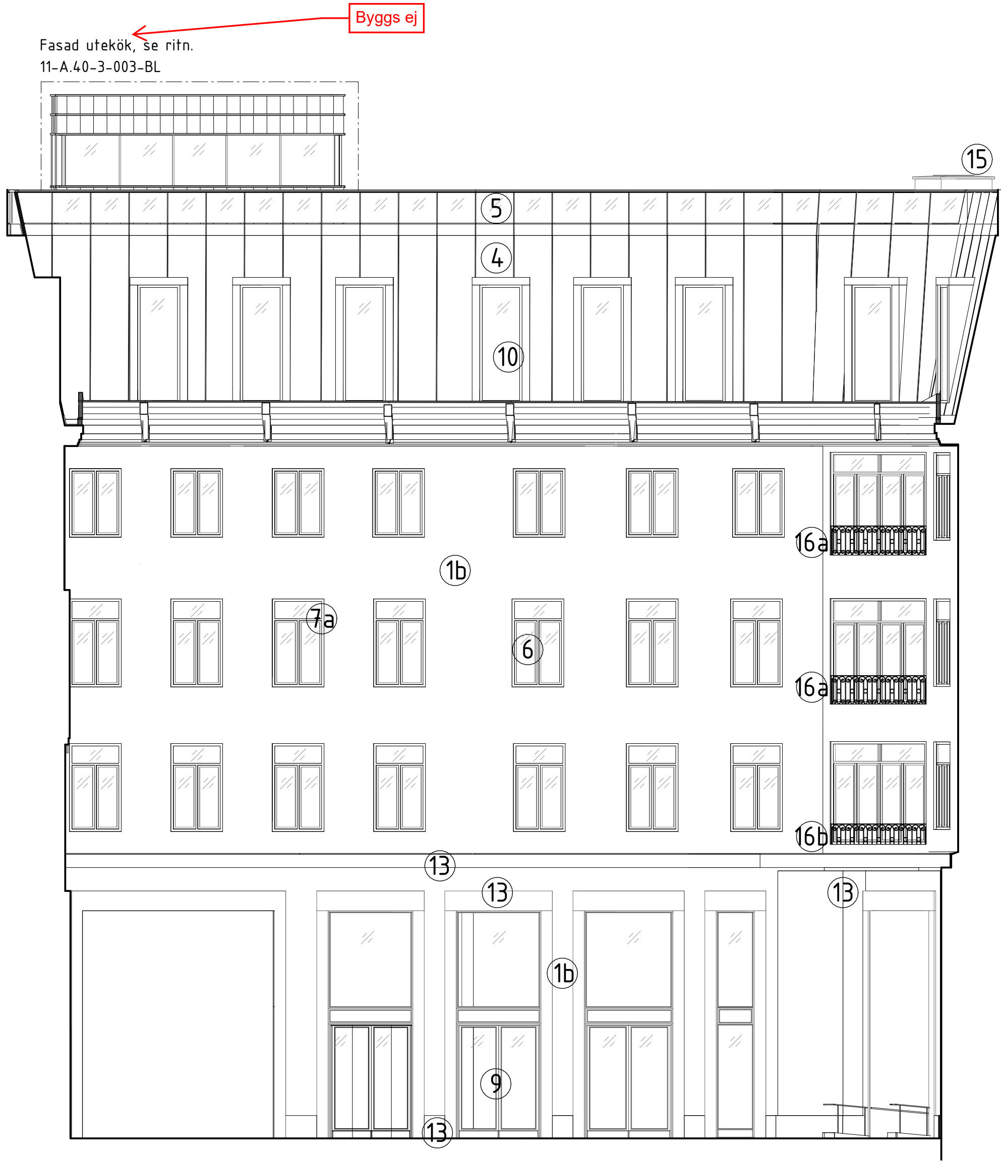
Bångskas innergård - Fasad mot norr 1:100