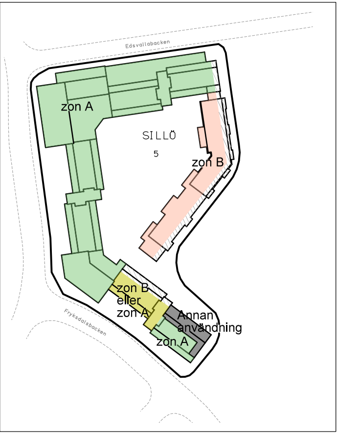
Illustration B. Illustration över zongränsen mellan zon A och zon B avseende industribuller. Enkelsidiga bostadslägenheter och ljuddämpad sida tillåts inte vid fasader med skräffering.