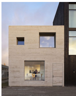
Litet fönster ihop med stort