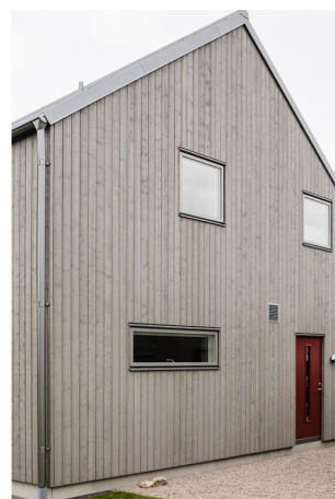
Material och kulör, vägg & fönster