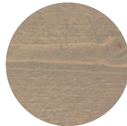
TREBITT 9076 SANDGRÅ

Pinnräcke: Metall, Kulör: NCS s 7005-B20G (blåsvart)