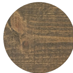
TREBITT 90031 ÅLDRAD GRÅ