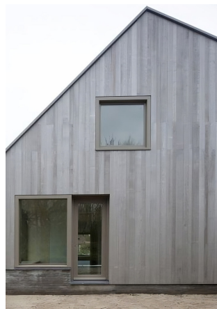
Material och kulör, vägg & fönster