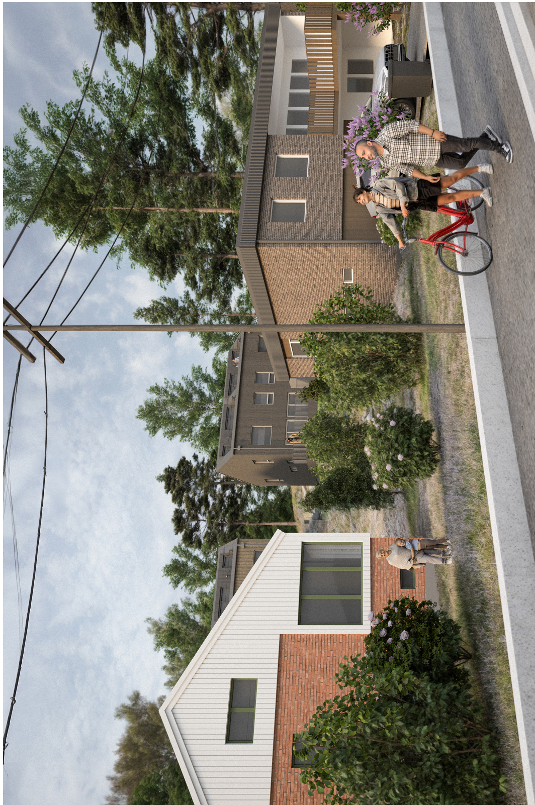
Vy från bergtorpsigen