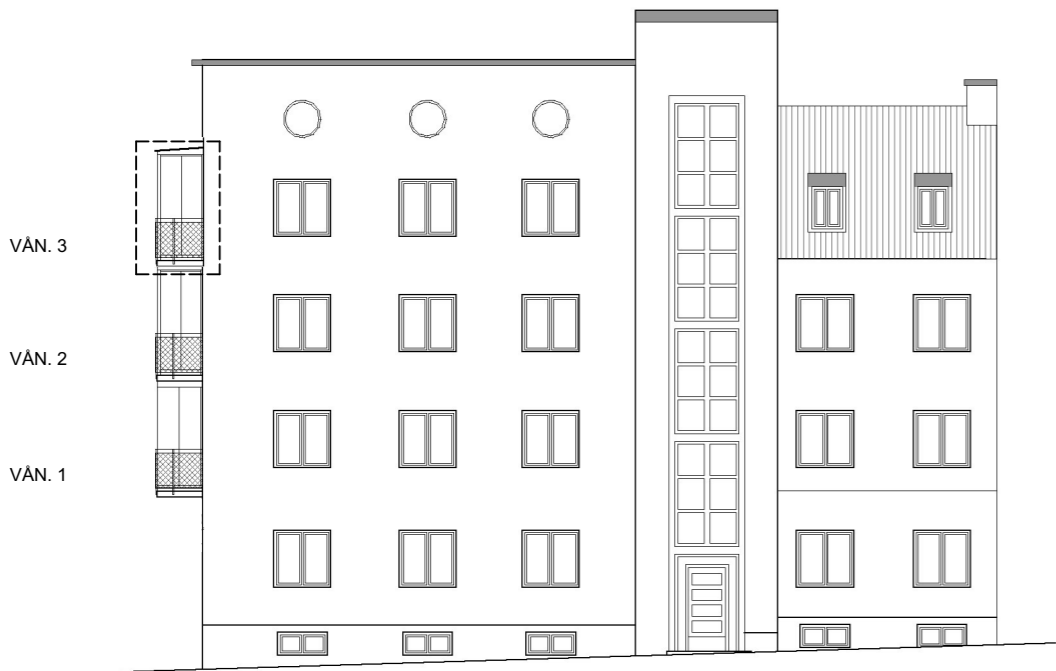
FASAD MOT NORDOST

RAD A Ny balkong vän 3 Se fasad mot sydost