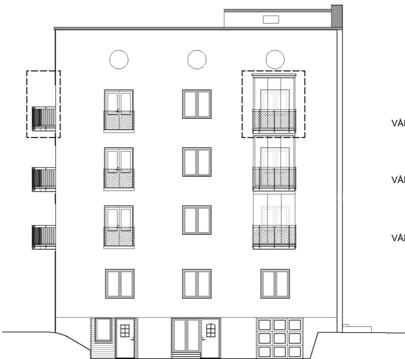
FASAD MOT SYDOST

RAD B Ny balkong vän 3 Se fasad mot sydväst