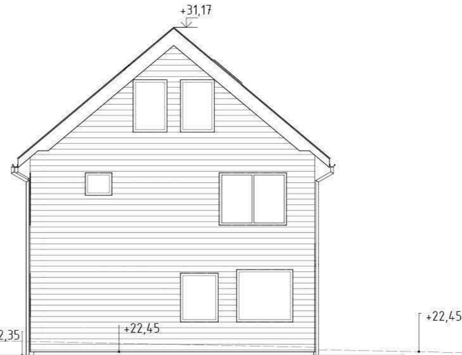
22-45 Fasad mot Väster