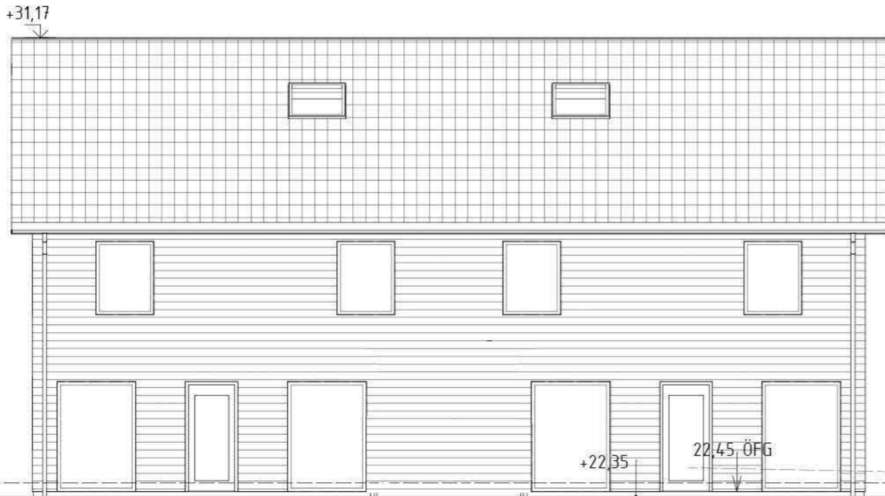
22-45 Fasad mot Söder

Inkom till Stockholms stadsbyggnadskontor - 2025-02-17, Dnr 2024-18459