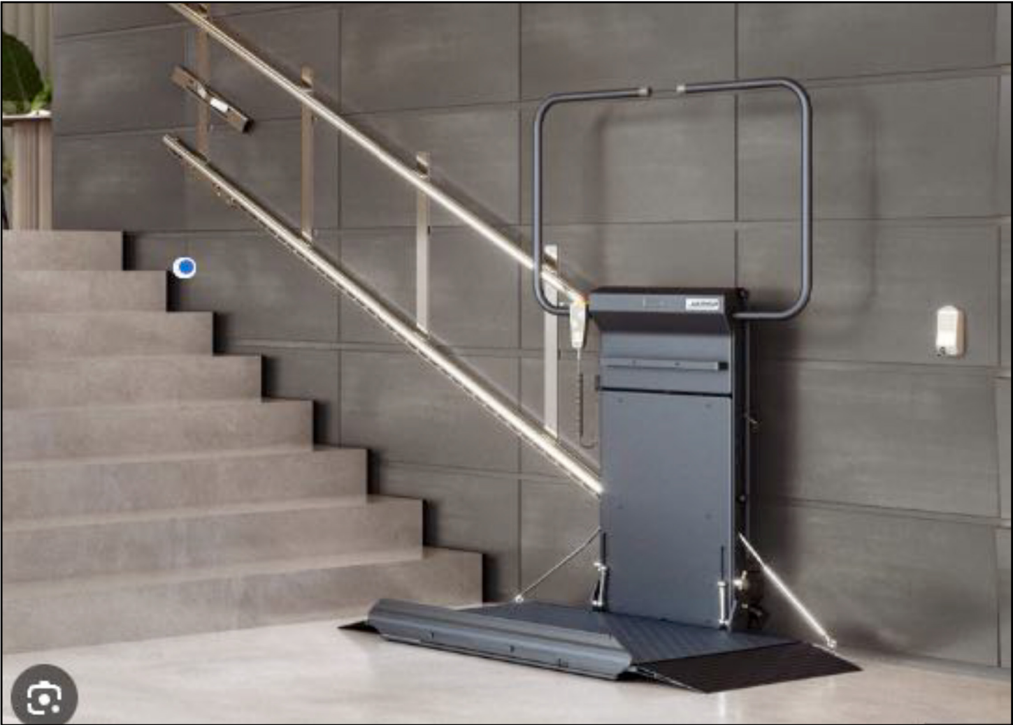
EXEMPEL PÅ TRAPPHISS SOM DESSUTOM KAN FÄLLAS UPP MOT VÄGGEN.