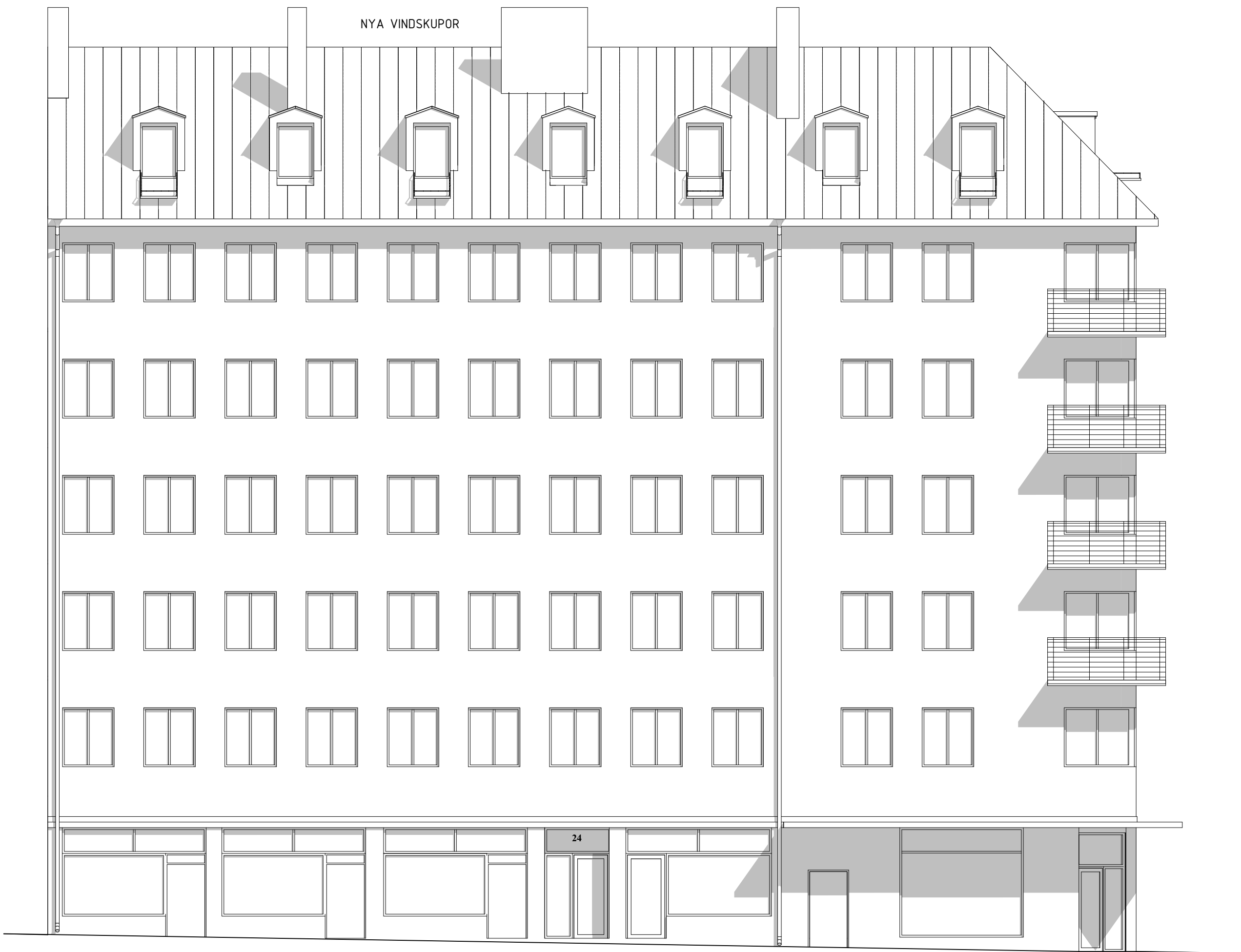
FASAD MOT YNGLINGAGATAN