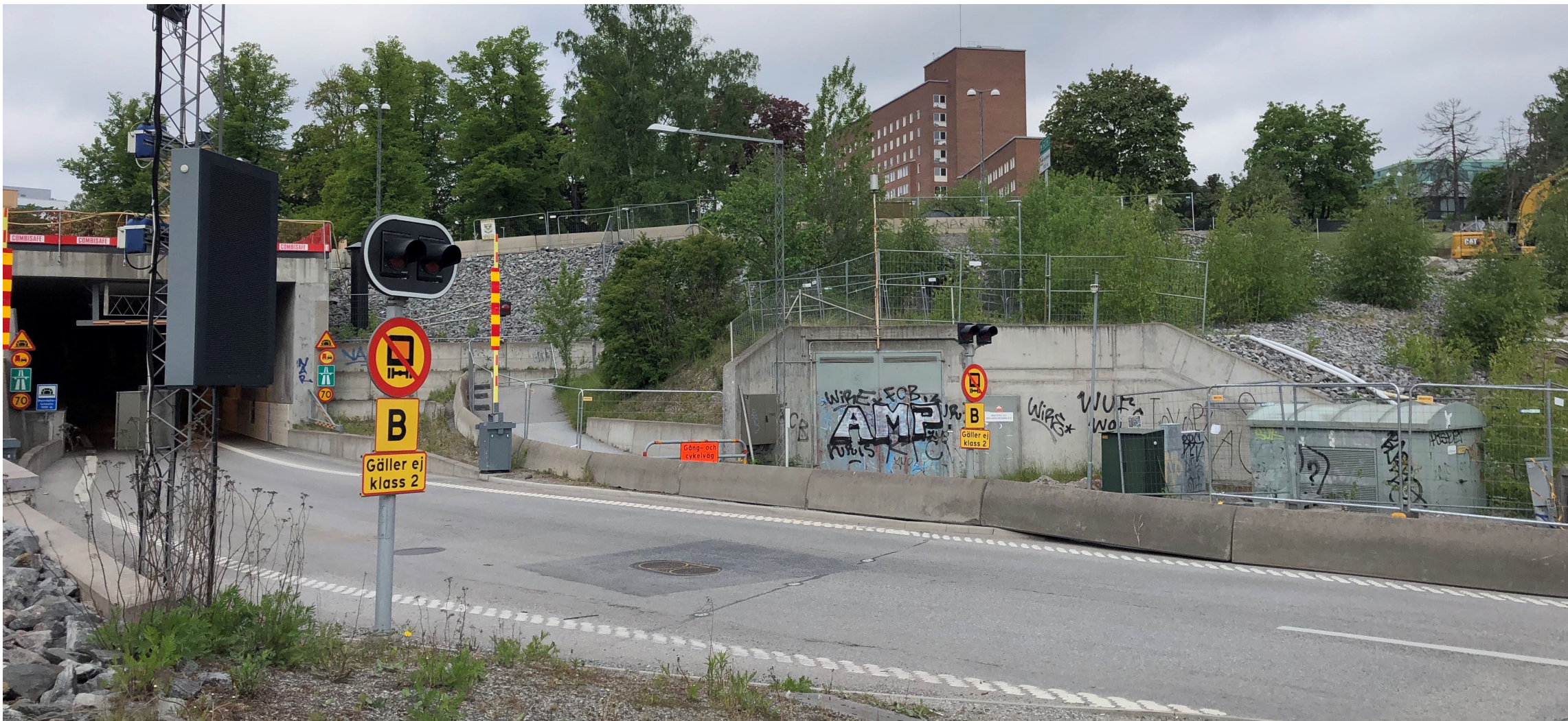
BILD AV BEFINTLIG STÖDMUR SOM RIVS