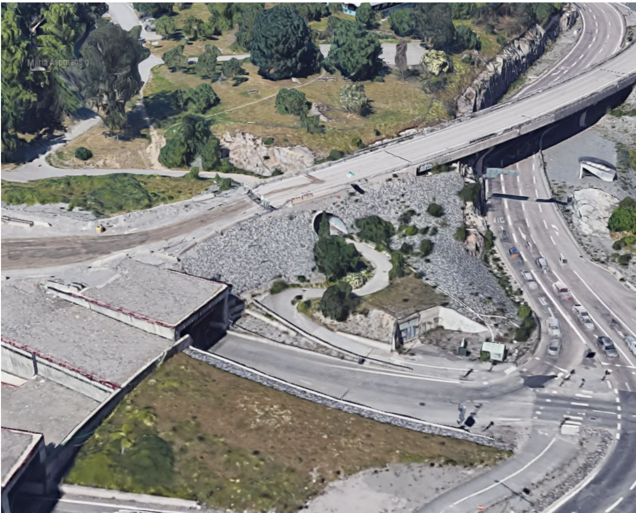
BILD AV BEFINTLIG STÖDMUR OCH GC-TUNNEL SOM RIVS

KOORDINATSYSTEM: SWREF 99 18 00 HÖJDSYSTEM: RH 2000 PLUSHÖJDER AVSER ÖVER HAVSNIVÅ.