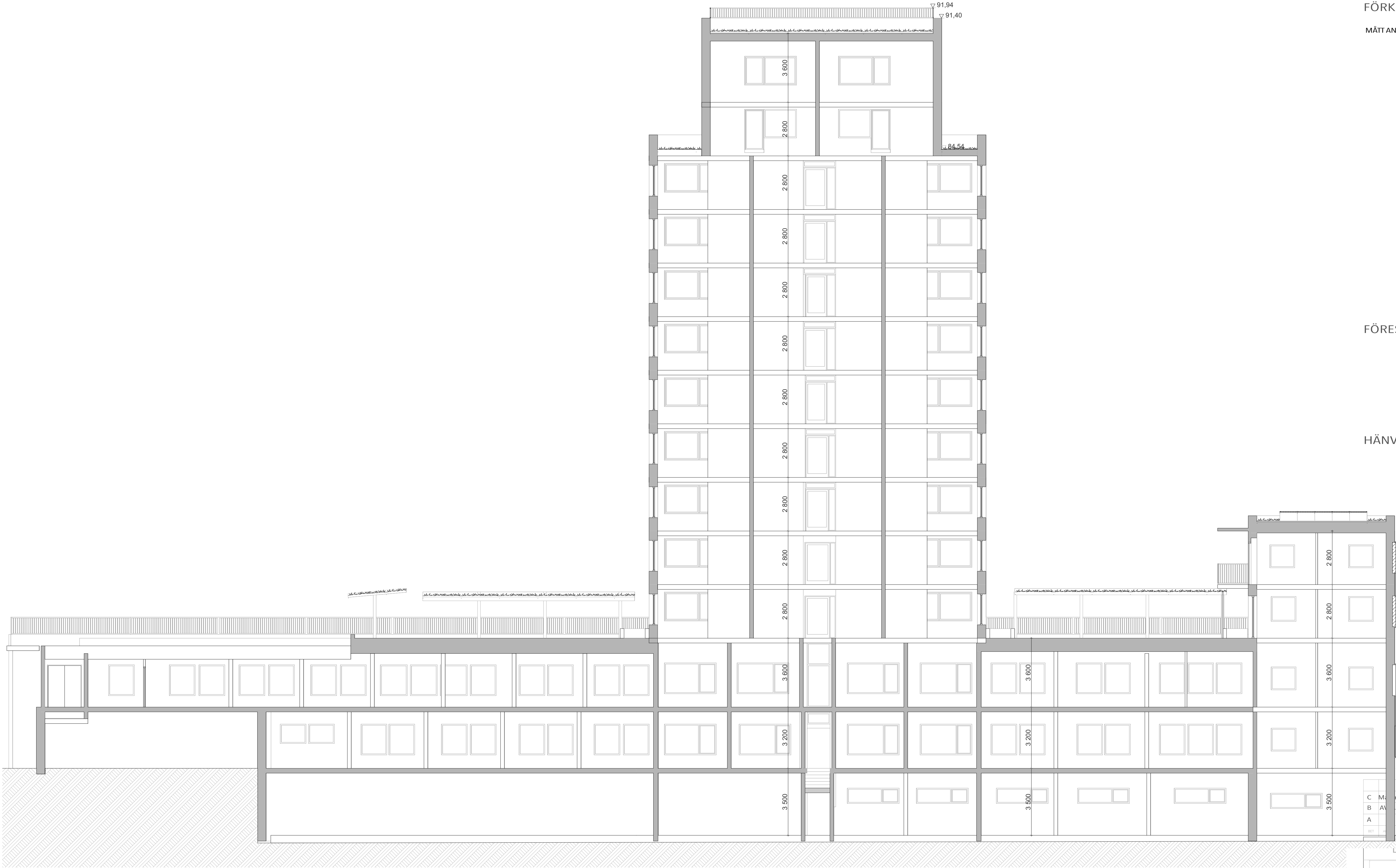
Sektion D D 1:100

Inkom till Stockholms stadsbyggnadskontor - 2025-02-04, Dnr 2024-10198