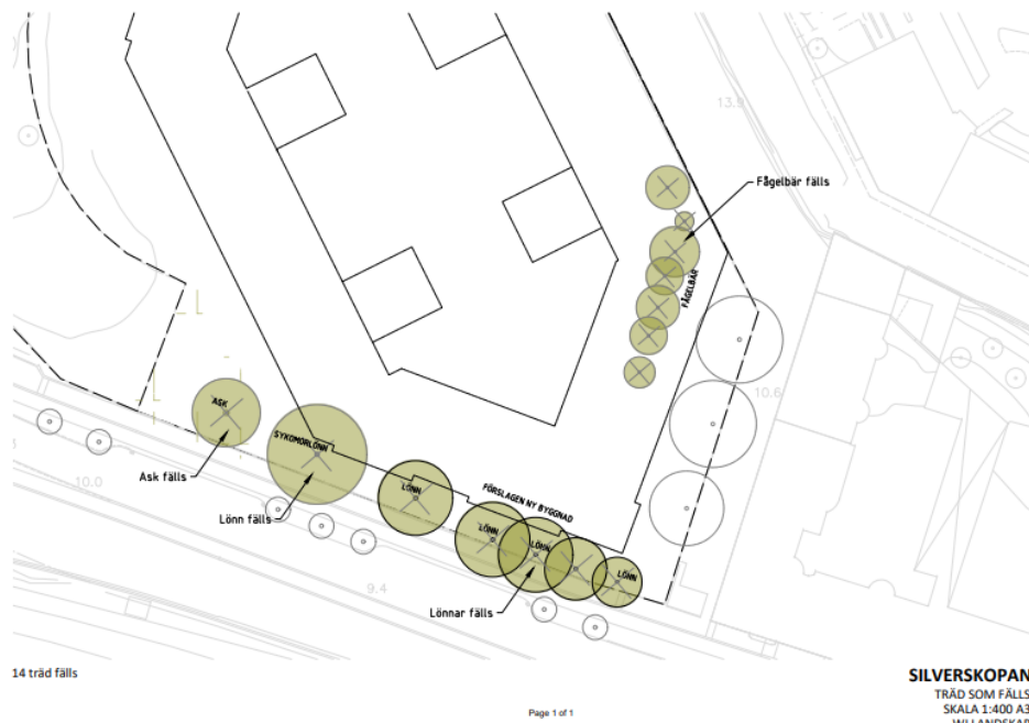
Figur 1. Alléträd längs med Torsgatan och Torsgränd som avses att avverkas.

Enligt ansökan avses totalt 14 alléträd att avverkas, se figur 1. Trädens ungefärliga ålder är 70 år och utgörs av arterna ask, skogslonn och fågelbär. Mulm förekommer i ask samt i en av skogslonnarna mot Torsgatan.